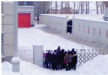
Các luật sư và gia đình tụ tập trước Trung tâm Tẩy não Thanh Long Sơn nhằm giải cứu các học viên Pháp Luân Công bị giam giữ.