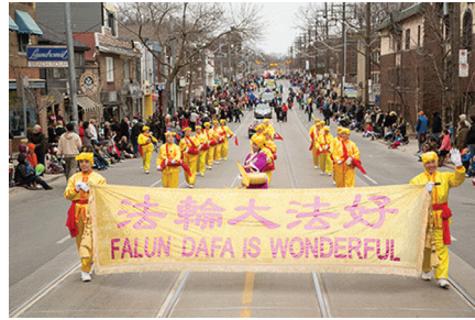
Đội trống lung đặc trưng cho nền văn hóa truyền thống của Trung Quốc

Năm nay, các học viên Pháp Luân Công đã trình diện hai nhóm nhạc thú vị – Thiên Quốc Nhạc Đoàn và đội trống lung truyền thống. Thiên Quốc Nhạc Đoàn đã tham gia lễ diễu hành sáu lần liên tiếp. Đây cũng là lần thứ hai đội trống lung Pháp Luân Công tham gia cuộc diễu hành Lễ Phục Sinh.