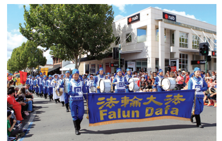
Thiên Quốc Nhạc Đoàn