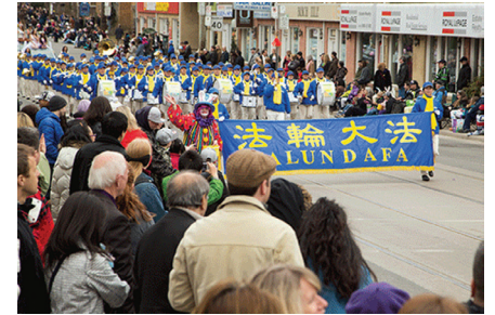
Thiên Quốc Nhạc Đoàn là đoàn lớn nhất tại cuộc diễu hành