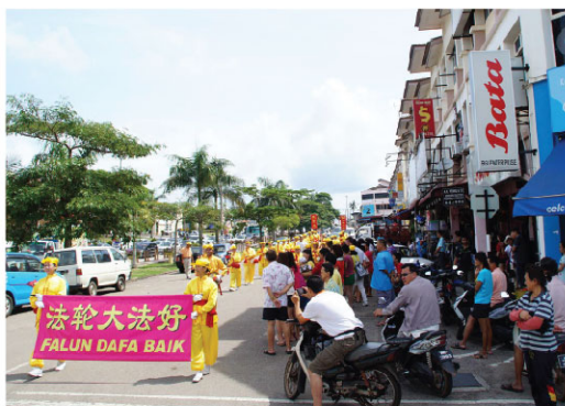
Các học viên diễu hành ở Bukit Gamir vào ngày mừng 07 Tết

Đài truyền hình địa phương đã đưa tin về màn trình diễn của các học viên vào ngày 16 tháng 02. ♦