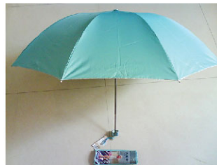
Ô Thiên Đường. Mặt bên trong được sơn bằng loại keo bạc có độc

Bà Hoàng nói “Tôi hiểu rất rõ tình huống được miêu tả trong thư thỉnh nguyện từ Trại lao động Mã Tam Gia, bởi tôi cũng đã đi lao động cưỡng bức khi bị giam cầm.”