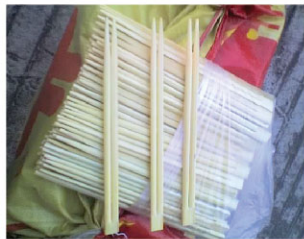
Đũa “hợp vệ sinh” được đóng gói trong những điều kiện khắc nghiệt

[MINH HUỆ] Từ khi bài viết “Lời kêu cứu từ Trại lao động khổ sai ở Trung Quốc, Chính phủ Mỹ điều tra” được đăng trên Minh Huệ, nhiều học viên Pháp Luân Công mà đã bị bức hại ở Trung Quốc và hiện đang sống ở nước ngoài, đã bước ra làm chứng việc lao động khổ sai tại nhiều nhà tù và trại lao động ở Trung Quốc. Dưới đây là những trường hợp học viên Pháp Luân Công trực tiếp trải qua việc lao động cưỡng bức tàn bạo tại nhiều trại lao động và trại tạm giam Trung Quốc.