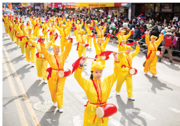
Trung tâm Dịch vụ Thoái ĐCSTQ Toàn cầu tham gia lễ diễu hành năm mới ở Flushing, New York