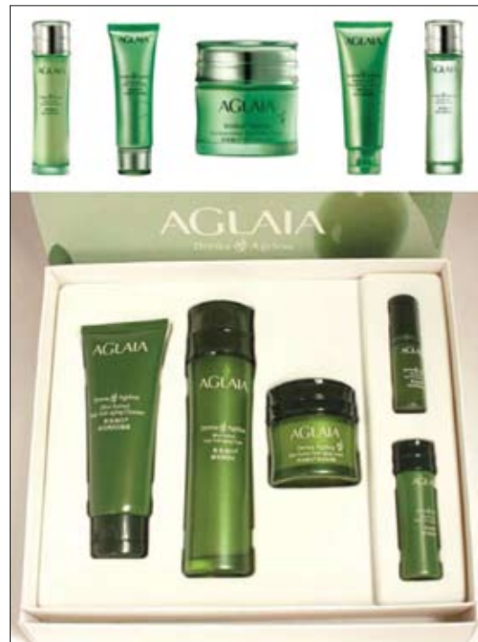
Những sản phẩm được làm bởi lao động khổ sai từ nhà tù nữ Liêu Ninh: Bộ chăm sóc da Aglaia (năm 2011, sản xuất tại đội số 04, khu giam giữ số 10 của nhà tù)

Nhà tù nữ tỉnh Liêu Ninh tra tấn các học viên Pháp Luân Công nhằm nỗ lực buộc họ từ bỏ niềm tin của mình. Hơn mười học viên đã bị bức hại đến chết ở nhà tù này. Người ở nhà tù cũng ép các học viên và các tù nhân khác đi lao động khổ sai. Cơ sở này có một xưởng may, một xưởng sản xuất giấy, và một xưởng sản xuất đồ mỹ phẩm (dây chuyền đóng chai), cùng những thứ