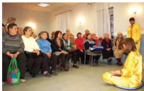
Giới thiệu Pháp Luân Công tại một trung tâm sinh hoạt của người cao tuổi ở St. Petersburg

Các học viên cũng tổ chức một hoạt động tương tự ở một trại trẻ mồ côi. Trẻ em từ 04 đến 15 tuổi đã xem biểu diễn các bài công pháp, múa quạt và múa lân một cách rất hào hứng. Các em cũng học năm bộ công pháp và học cách gấp hoa sen giấy. Một cậu bé 12 tuổi đã học cách nói “Pháp Luân Đại Pháp hảo” bằng tiếng Trung Quốc. Các giáo viên cũng nhân cơ hội này để tìm hiểu về Pháp Luân Đại Pháp. Họ đã bày tỏ lòng biết ơn chân thành đối với các học viên.◇