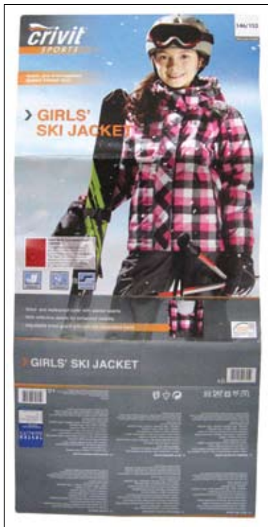
Bao bì đóng gói áo khoác trượt tuyết bé gái được xuất khẩu sang Đức

Nhãn hiệu áo khoác trượt tuyết “Crivit” của trẻ em