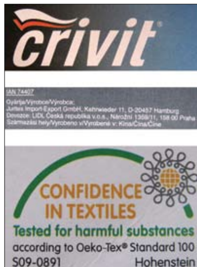
Nhãn hiệu và thông tin sản phẩm của áo khoác trượt tuyết bé gái