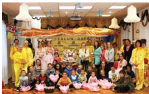
Giới thiệu Pháp Luân Công tại một trại trẻ mồ côi ở St. Petersburg

viên theo học, Pháp Luân Công đã mang lại nhiều cải thiện lớn về sức khỏe cho người học cũng như nâng cao phẩm chất đạo đức của họ. Chế độ cộng sản Trung Quốc đã bắt đầu đàn áp môn tu luyện bởi chế độ này có sùy cho Giả – Ác – Đấu, do đó nó không cho phép người dân thực hành theo các nguyên lý của Pháp Luân Công.”