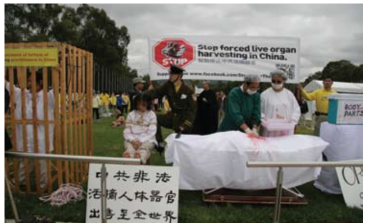
Tái hiện việc mổ cướp nội tạng từ các học viên Pháp Luân Công

Trong vòng hai tháng qua, hơn 30.000 người tại Sydney đã ký tên thỉnh nguyện kêu gọi chính phủ Úc phát động một cuộc điều tra độc lập đối với những cáo buộc về mổ cướp nội tạng ở Trung Quốc. Các thành viên Đảng Xanh đã gửi chữ ký đến chính quyền cấp tỉnh, nơi mà vấn đề này sẽ được thảo luận trong phiên họp Quốc hội sắp tới vào tháng hai. ◇