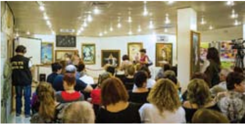
Những người tham dự lắng nghe phát biểu khai mạc Triển lãm Quốc tế nghệ thuật Chân – Thiện – Nhẫn ở Or Yehuda, Israel.

[MINH HUỆ] Mới đây, Triển lãm Nghệ thuật Chân – Thiện – Nhẫn đã khai mạc tại Hội trường Văn hóa thuộc thị trấn Or Yehuda, Israel.