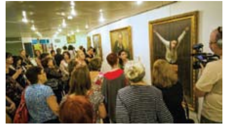
Công chúng chiêm ngưỡng các tác phẩm trong Triển lãm Nghệ thuật Chân Thiện Nhân ở Or Yehuda, Israel với sự giới thiệu của hướng dẫn viên.

nghe nói về Pháp Luân Đại Pháp. Bà cho biết bà cảm thấy những bức tranh này phản ánh sự quyết tâm của các học viên Đại Pháp trong việc làm rõ sự thật. Bà nói rằng các tác phẩm nghệ thuật này đã giúp bà nhận thức nhiều hơn về những vấn đề đang tồn tại trên thế giới, và thông điệp mà bà nhận được từ cuộc triển lãm là không đầu hàng và kiên định đấu tranh cho một thế giới tốt đẹp hơn.