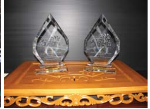
Tiết mục Pháp Luân Công đã giành hai giải thưởng tại Đại diễn hành hoa Toowoomba lần thứ 63: giải thưởng Đại lễ hội hoa Toowoomba và giải thưởng Đoàn có tinh thần lễ hội cao nhất

Năm nay, hơn 70 nhóm đã tham gia lễ diễn hành. Đoàn Pháp Luân Công được dẫn đầu bởi Thiên Quốc Nhạc Đoàn, tiếp theo là đoàn biểu diễn các bài công pháp, các vũ công rồng vàng, đoàn trang phục đời Đường, các thiên nữ, và một đội trống eo. Các học viên mang các biểu ngữ đầy màu sắc đề: “Pháp Luân Đại Pháp hảo” và “Thế giới cần Chân – Thiện – Nhân” bằng cả tiếng Hoa và tiếng Anh.