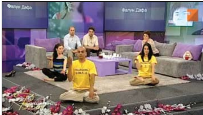
Kênh truyền hình quốc gia TV7 của Bulgaria phát sóng chương trình talkshow dài 50 phút về Pháp Luân Công

[MINH HUỆ] Ngày 20 tháng 09 năm 2012, kênh truyền hình quốc gia TV7 của Bulgaria đã giới thiệu môn tu luyện Pháp Luân Đại Pháp trên chương trình Talkshow buổi chiều “Chia sẻ với Vihra”. Các học viên Pháp Luân Công Bulgaria đã chia sẻ với người dẫn chương trình những câu chuyện về bản thân họ bắt đầu tập luyện như thế nào, những lợi ích thu được, và gia đình của họ đã chấp nhận Pháp Luân Đại Pháp ra sao. Các học viên đã biểu diễn năm bài công pháp. Người dẫn chương trình và khán giả trong phòng thu cũng tham gia màn biểu diễn các bài công pháp.