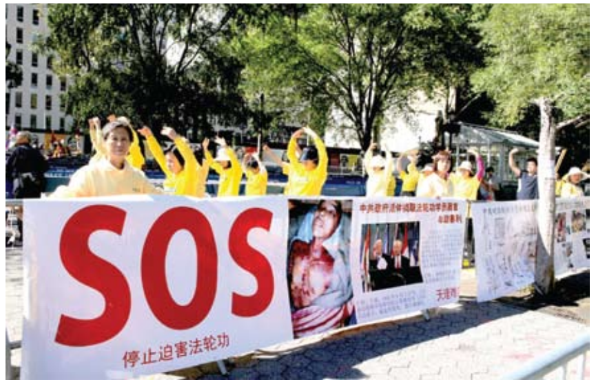
Các học viên Pháp Luân Công phơi bày tội ác của ĐCSTQ bên ngoài tòa nhà Liên Hiệp Quốc ở New York

Tội ác mô cướp nội tạng sống và sau đó giết hại các học viên Pháp Luân Công để kiếm lợi của ĐCSTQ đang bị phơi bày và lên án bởi cộng đồng quốc tế và người dân Trung Quốc. Trong suốt thời gian diễn ra phiên họp của Đại Hội đồng Liên Hợp Quốc, các học viên địa phương ở New York đã phân phát hàng nghìn bản sao của các báo cáo chi tiết về tội ác mô cướp nội tạng sống của ĐCSTQ cho những người tham dự phiên họp. Họ đã trưng các biểu ngữ lớn có dòng chữ “Chấm dứt mô cướp nội tạng sống”, “Các trại lao động của ĐCSTQ giết hại các học viên Pháp Luân Công vì tiên và hòa thiêu thi thể của họ để phi tang”, và “Những tội ác như vậy phải bị trừng phạt” bằng cả tiếng Trung Quốc và tiếng Anh. Các biểu ngữ này đã gây sự chú ý bên ngoài trụ sở của Liên Hợp Quốc và những người tham dự phiên họp có thể nhìn thấy từ xa.