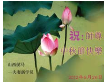
Các học viên mới từ Trung Quốc kính chúc Sư phụ Tết Trung thu vui vẻ!