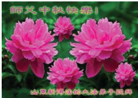
Các học viên mới từ Sơn Đông kính chúc Sư phụ Tết Trung thu vui vẻ!

Thông qua những nỗ lực giảng rõ sự thật về Pháp Luân Công của các học viên, ngày càng có nhiều người ở Trung Quốc nhận ra vẻ đẹp và sự tốt lành của Pháp Luân Đại Pháp. Từ đó, họ đã tiếp tục đến và bắt đầu tu luyện. Nhân dịp Tết Trung thu, các học viên mới này đã gửi lời chúc mừng đến Sư phụ và bày tỏ lòng biết ơn của họ đối với sự cứu độ từ bi của Ngài.