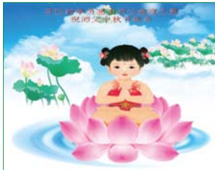
Các học viên mới, một cặp vợ chồng, từ Hàu Mã, thành phố Lâm Phần ở tỉnh Sơn Tây, kính chúc Sư phụ Tết Trung thu vui vẻ!