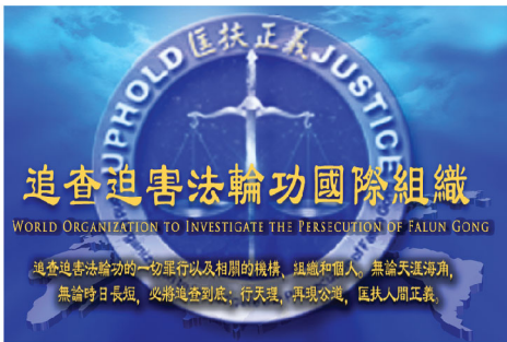
Biểu tượng của Tổ chức Thế giới Điều tra Cuộc đàn áp Pháp Luân Công

Ngày 20 tháng 07 năm 2012, WOIPFG đã phát hành cuốn sách điện tử: Các báo cáo điều tra về cuộc bức hại Pháp Luân Công. Cuốn sách có 22 tập, bao gồm 203 báo cáo và 4200 bằng chứng. Trong đó, tập Hai chủ yếu đưa ra bằng chứng về nạn mổ cướp nội tạng.