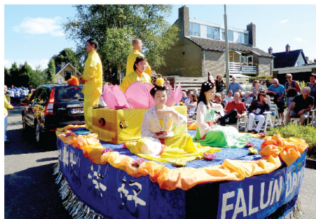
Các học viên Pháp Luân Công biểu diễn các bài công pháp trong cuộc diễu hành tại Lễ hội Hoa Eelde

Tham gia vào Thiên Quốc Nhạc Đoàn có hơn 100 học viên Pháp Luân Công từ khắp châu Âu. Các thành viên trong ban nhạc rất vui mừng khi thấy khán giả mỉm cười lắng nghe nghe tiếng nhạc của họ. Một