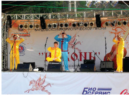
Các học viên ở Nga biểu diễn các bài công Pháp tại một sự kiện cộng đồng ở Nizhny Novgorod

Trong suốt khoảng thời gian cuối tháng 07 và đầu tháng 08 năm 2012, các học viên đã tổ chức Triển lãm Nghệ thuật Quốc tế Chân – Thiện – Nhân tại Trung tâm Triển lãm Văn hóa ở khu vực trung tâm thành phố Nizhny Novgorod trong vòng hai tuần. Đồng thời, họ đã biểu diễn các điệu múa và hát các bài hát do các học viên Pháp Luân Công sáng tác tại phòng trưng bày triển lãm, và đã nhận được sự hoan nghênh tán thưởng từ phía khán giả. Buổi tối, các học viên đã tổ chức thấp nến tưởng niệm tại Công viên Central Park để tưởng nhớ các đồng tu bị sát hại trong cuộc đàn áp của Đảng Cộng sản Trung Quốc (ĐCSTQ).