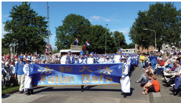
Thiên Quốc Nhạc Đoàn châu Âu tham gia vào cuộc diễu hành tại Lễ Hội Hoa Eelde

Bài của một học viên Pháp Luân Công Châu Âu