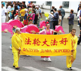
Các học viên tham gia vào một lễ diễu hành tổ chức ở Kostroma

Ngày 05 tháng 8, các học viên Pháp Luân Công đã tham gia lễ hội thành phố tại thành phố Eagle. Toàn bộ trung tâm thành phố chật kín người. Các học viên trong trang phục luyện công màu vàng đã biểu diễn các bài công pháp cùng các điệu múa ở công viên, và để lại cho người dân ở đó những kỷ niệm đáng nhớ. ♦