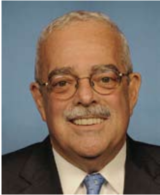
Gerald E. Connolly, Nghị sĩ Quốc hội