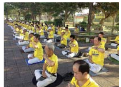
Các học viên Pháp Luân Công tổ chức tập các bài công pháp trong một công viên ở Okinawa

Một cụ bà 81 tuổi đang đi bộ vào buổi sáng và nghe thấy tiếng nhạc luyện công. Trong toàn bộ cơ thể bà cảm thấy rất tốt và ngồi xuống để xem các bài tập. Sau khi học sẽ có các học viên đến hướng dẫn tập miễn phí, bà hào hứng nói, “Ngay gần nhà tôi. Tôi có thể đến mỗi ngày.” ◇