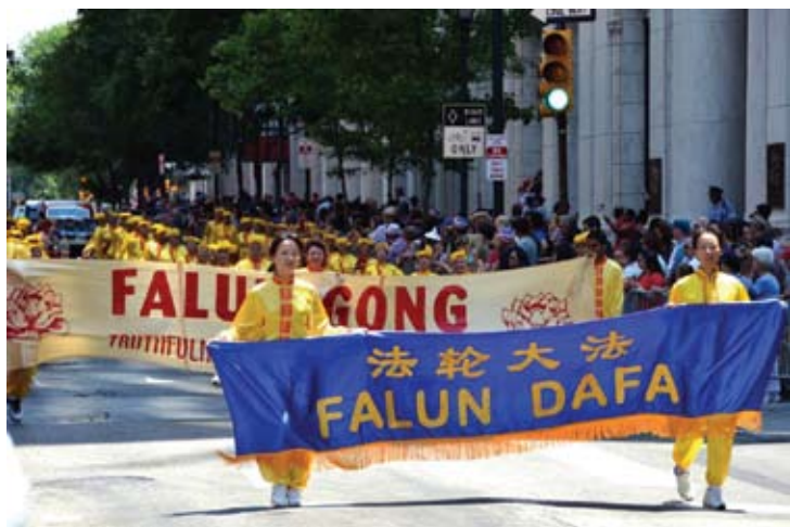
Đoàn diễu hành Pháp Luân Công

[MINH HUỆ] Ngày 04 tháng 07 năm 2012, kỷ niệm 236 Ngày Độc lập của Mỹ, lễ hội “Wawa chào mừng nước Mỹ” đã diễn ra ở Philadelphia, nơi khai sinh ra Tuyên ngôn Độc lập. Năm thứ 12 liên tiếp, các học viên Pháp Luân Công đã được mời đến tham gia sự kiện này, một trong những lễ kỷ niệm ngày 04 tháng 07 lớn nhất trong cả nước.