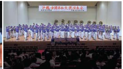
Ban nhạc biểu diễn các tiết mục “Hoa”, “Ánh lệ long lanh” và “Tặng bảo vật” cho các học sinh trung học của Okinawa.

Okinawa, ông đã mời họ đến biểu diễn tại Phòng Hòa Nhạc của Trung tâm Cộng đồng trong Tomigusuku cho giáo viên và học sinh.