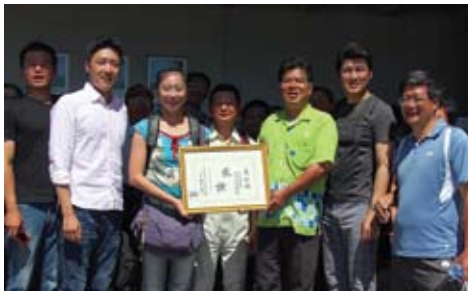
Thiên Quốc Nhạc Đoàn nhận được một bằng khen từ Giám đốc Hội đồng quản lý cho màn biểu diễn của mình ở Okinawa, Nhật Bản.

Chủ tịch của một trường đại học địa phương khi biết được rằng ban nhạc sẽ đến