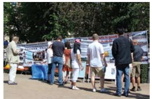
Các biểu ngữ và bảng trưng bày Pháp Luân Công thu hút người dân

một phần cuốn Chuyện Pháp Luân, và cảm nhận rằng cuốn sách thật uyên thâm. Ông nói: “Sự Phụ của các bạn thật phi thường!” và nói thêm: “Tôi cũng đã biết về cuộc bức hại ở Trung Quốc. Các bạn thật sự dũng cảm và xuất sắc. Tôi chúc các bạn thành công.”