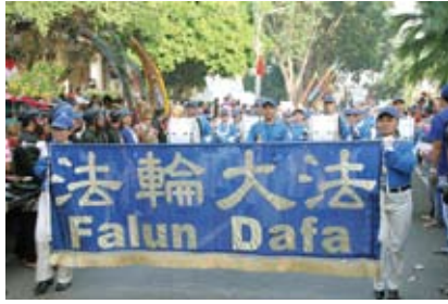
Đoàn Nhạc Thiên Quốc

Nhiều người dân địa phương rất thích đoàn nhạc vì giai điệu của họ, những bộ trang phục rực rỡ và các nguyên lý Chân – Thiện – Nhân mà các thành viên của đoàn nhạc tuân theo. ◇