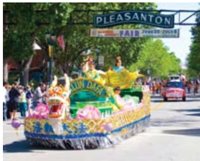
Thuyền của các học viên Pháp Luân Công

thoát ông Chung hay không – có ý nghĩa nghiêm trọng hơn là số phận của một con người”. “Với việc cảnh sát bí mật tùy tiện bắt cóc một doanh nhân Đài Loan, các quan chức Đảng Cộng sản Trung Quốc (ĐCSTQ) đã tạo ra một tiền lệ đáng sợ cho bất kỳ người Đài Loan nào đến Trung Quốc, nếu người đó có thể đã làm điều gì đó mà ĐCSTQ không thích.”