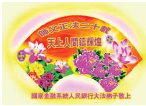
Các học viên Pháp Luân Đại Pháp ở hệ thống tài chính Chúc mừng sinh nhật Sư Tôn và Chúc mừng Ngày Pháp Luân Đại Pháp thế giới!

[MINH HUỆ] Hai mươi năm trước cũng vào tháng 05 này, Sư Phụ Lý Hồng Chí đã giới thiệu Pháp Luân Đại Pháp ra công chúng tại thành phố Trường Xuân, Trung Quốc. Kể từ đó Pháp Luân Đại Pháp đã được hồng truyền trên khắp thế giới. Khoảng hơn 100 triệu học viên đang tuân theo các tiêu chuẩn Chân-Thiện-Nhẫn và đã thu được rất nhiều lợi ích cả về cả tâm tính lẫn thân thể. Mười ba năm qua, mỗi khi đến ngày 13 tháng 05, các học viên Pháp Luân Đại Pháp trên khắp thế giới lại gửi các tấm thiệp chúc mừng đến trang web Minghui.org (trang Minh Huệ tiếng Trung) để kỷ niệm Ngày Pháp Luân Đại Pháp thế giới và chúc Sư Phụ tôn kính sinh nhật vui vẻ. Dưới đây là một số thiệp mừng năm nay được chọn để công bố. ◇