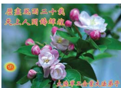
Các học viên Pháp Luân Đại Pháp ở các doanh nghiệp quân sự Trung Quốc Chúc mừng sinh nhật Sư Tôn và Chúc mừng Ngày Pháp Luân Đại Pháp thế giới!