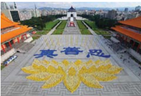
Hơn 5.000 học viên đã xếp hình một bông hoa sen khổng lồ và ba chữ Trung Quốc "Chân-Thiện-Nhẫn" vào ngày 27 tháng 11 năm 2010.