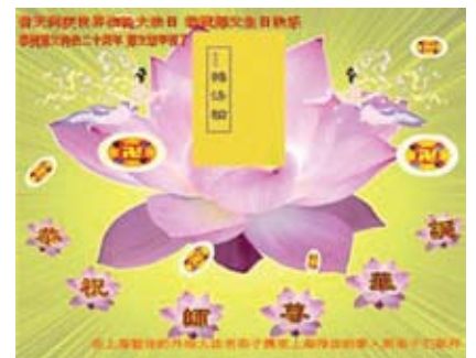
Các học viên là những cựu quân nhân của lực lượng không quân chúc mừng Ngày Pháp Luân Đại Pháp Thế Giới!