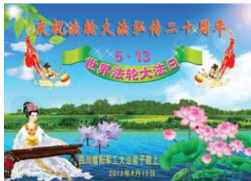
Các học viên trong ngành Công nghiệp quốc phòng ở Miền Dương, tỉnh Tứ Xuyên, mừng kỷ niệm lần thứ 20 ngày Pháp Luân Đại Pháp hồng truyền!