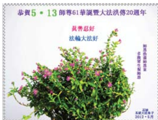
Các học viên Pháp Luân Đại Pháp ở ngành dầu khí Chúc mừng sinh nhật Sư Tôn và Chúc mừng kỷ niệm 20 năm Pháp Luân Đại Pháp hồng truyền!