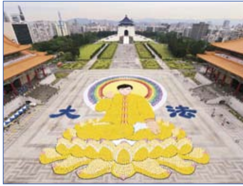
Tại Quảng trường Tự do ở Đài Bắc, 7.400 học viên Pháp Luân Công tạo thành hình ảnh của Sư Phụ Lý Hồng Chí, người sáng lập Pháp Luân Công - một cảnh tượng huy hoàng, vào ngày 29 tháng 04 năm 2012.

[MINH HUỆ] Vào ngày 29 tháng 04 năm 2012, nhân kỷ niệm 17 năm Pháp Luân Công được phổ truyền tại Đài Loan, 7.400 học viên Pháp Luân Công đã tập hợp tại Quảng trường Tự do ở Đài Bắc và xếp hình chân dung Sư Phụ Lý Hồng Chí, người sáng lập Pháp Luân Công. Các học viên chuẩn bị trong ba ngày cho sự kiện này, và những người tham gia chuẩn bị và xếp hình đều cảm nhận thấy bầu không khí thù thắng và trang nghiêm. Họ cảm thấy vinh dự và may mắn khi được đích thân tham dự sự kiện to lớn này.