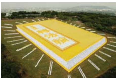
Sáu nghìn học viên trong khu vực châu Á-Thái Bình Dương xếp một mô hình lớn của cuốn sách Chuyên Pháp Luân để bày tỏ lòng tôn kính đối với Sư phụ Lý Hồng Chí, ngày 21 tháng 11 năm 2009.