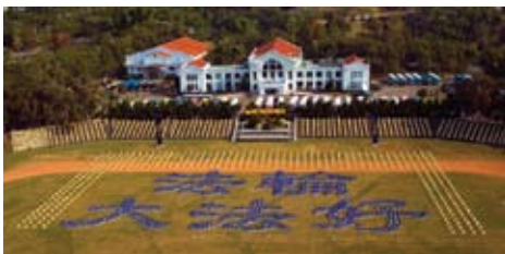
Khoảng 4000 học viên xếp thành các chữ Trung Quốc "Pháp Luân Đại Pháp là tốt" tại ngôi làng nhỏ mới mở Trung Hưng, huyện Nam Đầu, ngày 01 tháng 12 năm 2007.