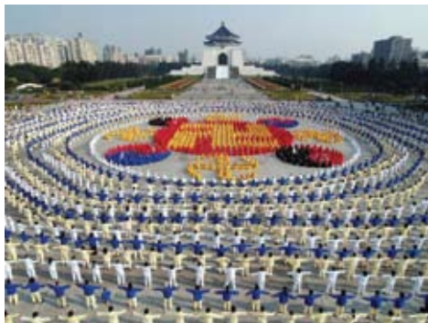
Bốn nghìn học viên xếp thành một Đồ hình Pháp Luân tại Đài Loan vào ngày 25 tháng 12 năm 2005.