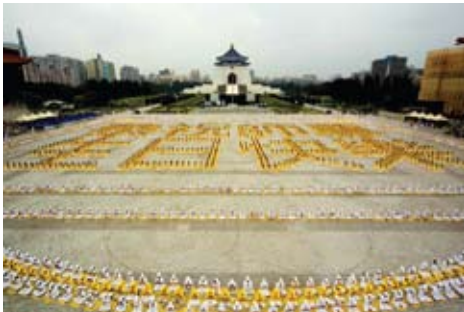
Hơn 5.000 học viên xếp thành các chữ Trung Quốc "Cung chúc Sư Tôn sinh nhật vui vẻ" tại quảng trường kỷ niệm đường Trung Chính, thành phố Đài Bắc, Đài Loan, ngày 13 tháng 05 năm 2007.