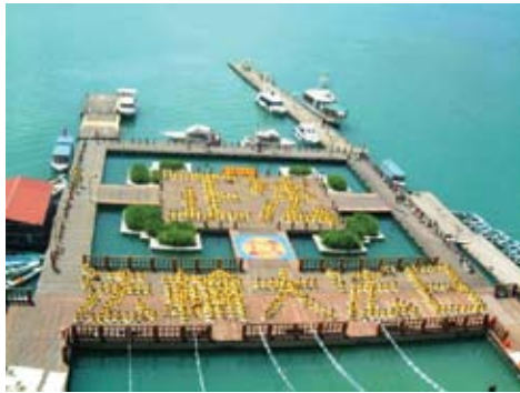
Tháng 07 năm 2002, kỷ niệm Ngày Pháp Luân Đại Pháp Thế Giới

Dưới đây là một số hình ảnh các hoạt động xếp chữ Trung Quốc và tạo hình tại Đài Loan trong những năm qua.