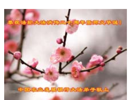
Các học viên Pháp Luân Đại Pháp ở Ngân hàng Phát triển Nông nghiệp Trung Quốc Chúc mừng sinh nhật Sư Tôn và Chúc mừng kỷ niệm 20 năm Pháp Luân Đại Pháp hồng truyền!