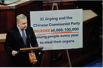
Nghị sỹ Chris Smith phát biểu tại Hạ viện.

Ngày 27 tháng 3 năm 2023, Hạ viện Hoa Kỳ đã thông qua dự luật H.R. 1154, Đạo luật Chấm dứt nạn Cưỡng bức Thu hoạch Nội tạng. Dự luật này nhằm trừng phạt những người tham gia vào hoạt động thu hoạch nội tạng sống của ĐCSTQ từ tù nhân lương tâm, đặc biệt là các học viên Pháp Luân Công và người Duy Ngô Nhĩ.