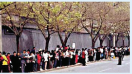
Hình ảnh các học viên đứng ôn hòa trật tự thỉnh nguyện, không mang theo biểu ngữ (ngày 25 tháng 4 năm 1999).

Đến năm 2009, hai Luật sư nhân quyền nổi tiếng là David Kilgour và David Matas xuất bản cuốn “Thu hoạch Đẫm máu: Thu hoạch nội tạng của các học viên Pháp Luân Công tại Trung Quốc” (Bloody Harvest) đã phơi bày rõ nạn mô cướp nội tạng sống từ các học viên Pháp Luân Công do ĐCSTQ hậu thuẫn, trong đó có đến hàng triệu người đã bị giam giữ hoặc bỏ tù chỉ vì đức tin của mình.