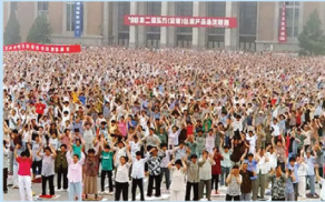
Tp. Thẩm Dương (trước năm 1999)

Công đã vô cùng phổ biến ở Trung Quốc. Vào cuối những năm 1990, theo thống kê của Chính phủ Trung Quốc có khoảng 70 -100 triệu người theo học pháp môn này.