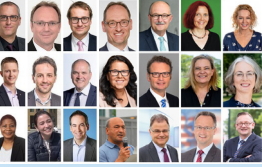
Các quan chức chính phủ trên toàn thế giới lên tiếng ủng hộ Pháp Luân Công.

Ngày 23/12/2016: Hoa Kỳ ban hành Đạo luật Truy cứu Trách nhiệm Nhân quyền Toàn cầu Magnitsky , cho phép trừng phạt thủ phạm nhân quyền nước ngoài và thân nhân của họ dưới hình thức cấm nhập cảnh và đóng băng tài sản. Đến nay, hơn 30 quốc gia (Canada, Anh và 27 quốc gia châu Âu, Úc, Đài Loan...) đã ban hành luật tương tự.