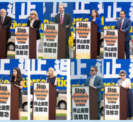
Các diễn giả trong cuộc mít-tinh tại National Mall ngày 20 tháng 7.

"Chúng ta và các quốc gia còn lại của thế giới cần phải tiến lên. Chúng ta phải hành động, chúng ta phải hành động một cách quyết liệt." (Nghị sỹ Chris Smith phát biểu tại Hạ viện) Chi tiết xem tại: bit.ly/41uLapy