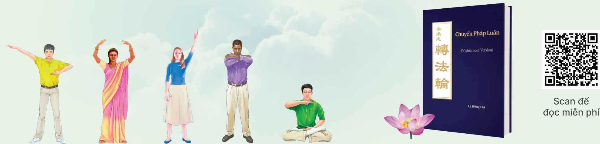
Năm Bài Công Pháp

Các sách và tài liệu (audio 9 bài giảng và video hướng dẫn 5 bài công pháp) của Pháp Luân Đại Pháp có thể xem/nghe trực tuyến hoặc tải miễn phí tại: vn.falundafa.org Đăng ký học trực tuyến miễn phí tại: hocphapluancong.com