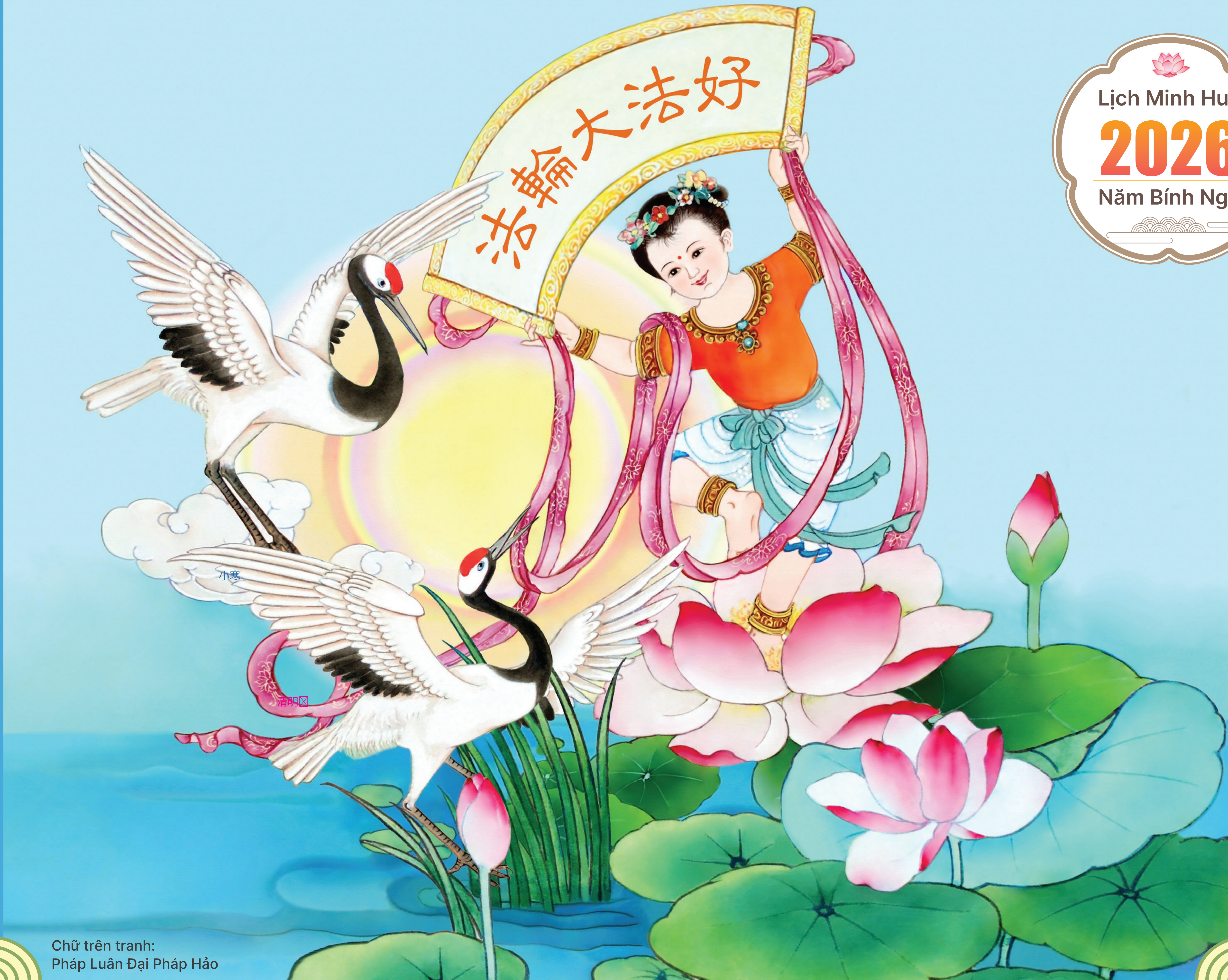
Chữ trên tranh: Pháp Luân Đại Pháp Hảo