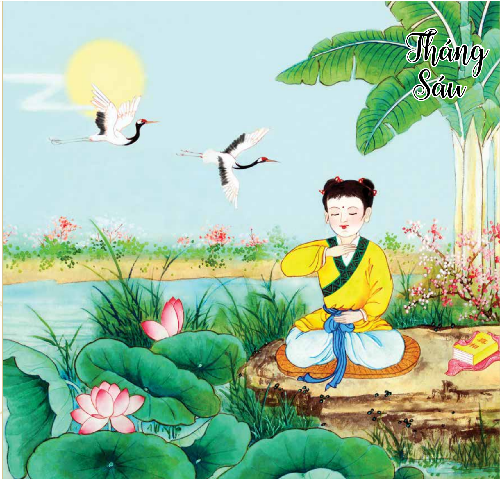
Chữ trên tranh: Chân tướng