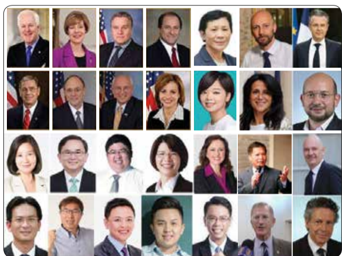
Các nhà lập pháp Hoa Kỳ và Canada, các quan chức chính phủ, các nhà lãnh đạo, các quan chức đặc cử của Pháp, Đức, Úc, Đài Loan bày tỏ ủng hộ đối với Pháp Luân Công và lên án cuộc bức hại Pháp Luân Công tại Trung Quốc.

Pháp Luân Đại Pháp giảng rằng, vũ trụ này là tồn tại vật chất, được cấu thành từ những lập tử nhỏ bé nhất cho đến to lớn hơn nữa (các hành tinh, các thiên hà...), đồng thời vũ trụ cũng có tồn tại đặc tính Chân-Thiện-Nhẫn . Người xưa vẫn tin rằng con người là một thực thể trong vũ trụ, mà tâm và thân là một thể thống nhất. Khi con người sống hài hòa với vũ trụ, có tiêu chuẩn đạo đức cao, tôn trọng và phù hợp với đặc tính của vũ trụ, thì sẽ có thân thể khỏe mạnh, nội tâm an hòa, cuộc sống nhờ vậy mà được bình an. Người chân chính tu luyện, nếu liên tục đồng hóa với đặc tính Chân-Thiện-Nhẫn của vũ trụ, thì sẽ có thể đạt đến cảnh giới mà phương Đông gọi là “giác ngộ” hay “đắc Đạo”.