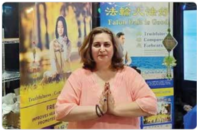
Cô Elham cảm ân Sư phụ Pháp Luân Đại Pháp đã giúp cô minh bạch ý nghĩa nhân sinh.

Cuộc sống của cô Elham (người Trung Đông) hết sức lận đận, cô còn bị u não. Trong lúc tuyệt vọng, cô cầu xin Thần giúp đỡ. Sau đó, cô đọc được cuốn “Chuyển Pháp Luân” và cảm thấy thông suốt. Cô cho hay: “Tôi hiểu được sinh mệnh đáng quý biết bao. Tôi đã đến viện để điều trị u não. Nhưng sau khi đến bệnh viện tốt nhất địa phương, bác sỹ nói tôi rất khỏe mạnh, không bị ung thư.” Cô nhớ lại trong sách “Chuyển Pháp Luân” có đoạn: “Nhưng là người tu luyện chân chính, chư vị mang theo thân thể có bệnh, [thì] chư vị tu luyện không được. Tôi phải giúp chư vị tịnh hoá thân thể.” Cô hiểu ra và cảm tạ Sư phụ đã ban cho cô sinh mệnh mới để có thể bước trên con đường tu luyện.