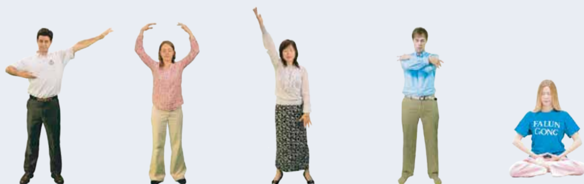
Năm bài công pháp của Pháp Luân Đại Pháp