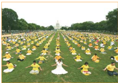
Hàng nghìn học viên Pháp Luân Công đến từ khắp nơi trên thế giới tụ tập tại thủ đô Washington, DC, Mỹ, cùng luyện công tập thể trước tòa nhà quốc hội Mỹ.

Pháp Luân Đại Pháp, còn gọi là Pháp Luân Công, là Đại Pháp tu luyện thượng thừa của Phật gia, lấy đặc tính vũ trụ “Chân-Thiện-Nhẫn” làm nguyên tắc chủ đạo, bao gồm năm bài công pháp nhẹ nhàng, thanh thoát. Sau khi được truyền ra công chúng, Pháp Luân Đại Pháp đã nhận được sự hoan nghênh của đông đảo người dân nhờ vào hiệu quả chữa bệnh kỳ diệu, chỉ trong vài năm ngắn ngủi, pháp môn đã lan truyền ra khắp đất nước Trung Quốc.