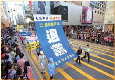
Các học viên Pháp Luân Công tại Hồng Kông tổ chức diễu hành chúc mừng 200 triệu người dân Trung Quốc thoát xuất khỏi Đảng, Đoàn, Đội của Trung Cộng. Dân chúng hai bên đường kính ngạc và nô nức chụp ảnh.