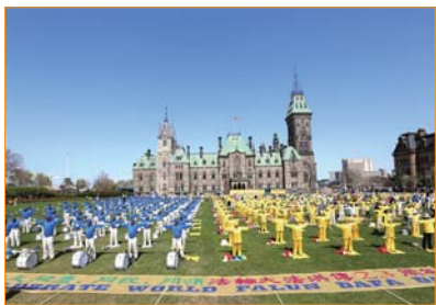
Tại Canada, từ tổng thống đến người dân đều yêu mến và ca ngợi Pháp Luân Công. Đây là hình ảnh các học viên Pháp Luân Công luyện công tập thể trước Tòa nhà Quốc hội Canada.