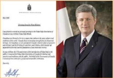
Thủ tướng Canada - ngài Harper liên tục 10 năm liền gửi thư chúc mừng ngày “Pháp Luân Đại Pháp Thế giới”, ca ngợi Pháp Luân Đại Pháp vì những đóng góp cho xã hội.