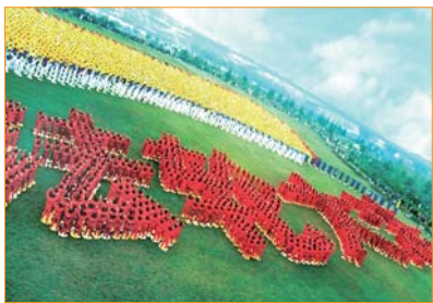
Năm 1999, tại công viên Hán Thủy, thành phố Vũ Hán, Trung Quốc, gần 10.000 học viên Pháp Luân Công xếp chữ “Pháp Luân Đại Pháp”