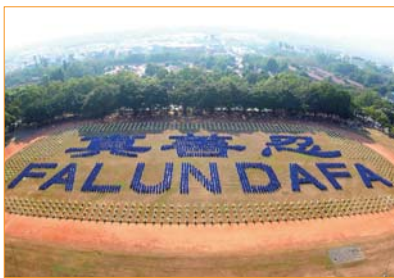
Hơn 3.000 học viên Pháp Luân Công cùng xếp chữ “Chân-Thiện-Nhẫn” và “Pháp Luân Đại Pháp” tại sân vận động thôn Trung Hưng, huyện Nam Đảo, Đài Loan.