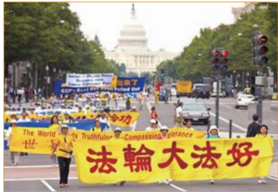
Trên đại lộ Pennsylvania tại thủ đô Washington DC, Mỹ, đoàn diễu hành của các học viên Pháp Luân Công tưng bừng triển hiện cho người dân vẻ đẹp của Pháp Luân Đại Pháp.

Sự phản kháng ôn hòa, lý trí và đầy từ bi của các học viên Pháp Luân Công ở Trung Quốc cũng như trên toàn thế giới trước cuộc bức hại, tàn bạo của ĐCSTQ đã lay động trái tim hàng triệu người lương thiện. Hoạt động thu thập chữ ký thỉnh nguyện kêu gọi chấm dứt cuộc bức hại phi lý và nạn mổ cướp tạng từ các học viên Pháp Luân Công còn sống do ĐCSTQ hậu thuẫn ở Trung Quốc giành được sự ủng hộ rộng khắp của người dân mọi tầng lớp. Đặc biệt là ở Trung Quốc, với lương tri thức tỉnh, người dân đã đứng lên lựa chọn chính nghĩa và công lý, tách mình khỏi sự kiểm soát của một thực thể tàn bạo. Tính đến tháng 12 năm 2015, toàn thế giới đã có hơn 220 triệu người thoát khỏi ĐCSTQ và các tổ chức liên đới của nó.