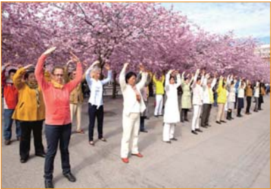
Vào đầu tháng 5, các học viên Pháp Luân Công tại Thụy Điển luyện công tập thể dưới tán cây hoa anh đào nở rộ trong công viên Hoàng gia, chào mừng ngày “Pháp Luân Đại Pháp Thế giới”.