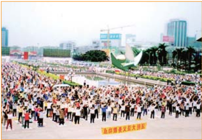
Năm 1998, đài truyền hình Quảng Châu, Trung Quốc đã bức ảnh các học viên Pháp Luân Công đang luyện công tập thể vào buổi sáng sớm tại một điểm luyện công ở thành phố Quảng Châu.