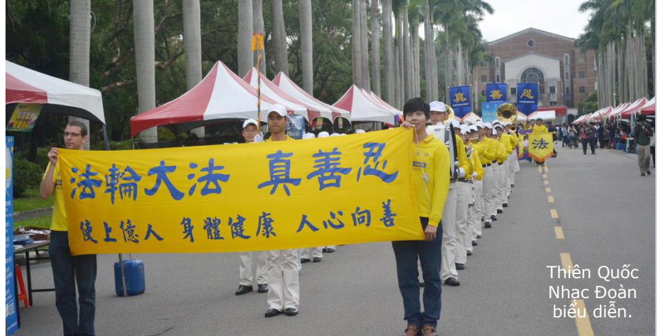
Thiên Quốc Nhạc Đoàn biểu diễn.