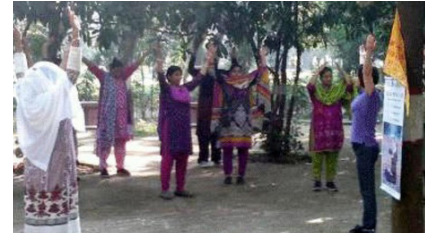
Các học viên Pháp Luân Công [tình nguyện] dạy các bài công pháp Pháp Luân Công miễn phí tại công viên Ramma.

Tôi vô cùng may mắn được là một đệ tử của Sư phụ trong giai đoạn cuối cùng của thời kỳ Chính Pháp. Miễn là chúng ta hoàn toàn tín Sư, Sư phụ sẽ mở rộng cửa thiên giới chờ đón chúng ta. ■