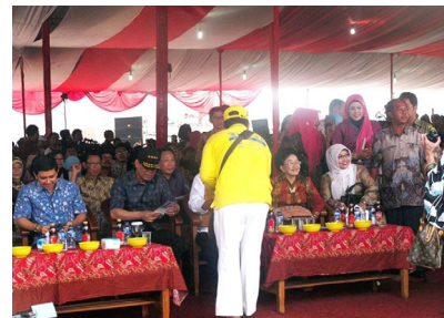
Hai Bộ trưởng Bộ Nội vụ (bên trái) đọc các tài liệu về Pháp Luân Công.