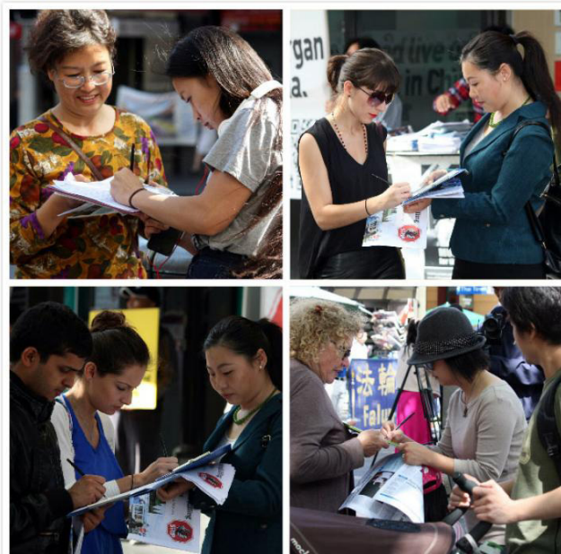
Người dân tìm hiểu về cuộc bức hại Pháp Luân Công và ký tên thỉnh nguyện ủng hộ các học viên tại Trung Quốc.

Cũng nhân sự kiện này, rất nhiều người dân cũng ký tên thỉnh nguyện nhằm góp phần kêu gọi chấm dứt nạn mổ cướp tạng do chính phủ Trung Quốc hậu thuẫn. ■