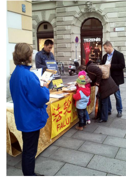
Thu thập chữ ký tại Graz, thành phố lớn thứ hai tại Áo, nhằm nâng cao nhận thức về việc Đảng Cộng sản Trung Quốc mổ cướp nội tạng sống từ các học viên Pháp Luân Công và các tù nhân lương tâm khác.

Ngày 09 tháng 07 năm 2014, Hội đồng Châu Âu đã thông qua Công ước chống Buôn bán Nội tạng của Con người, Hội đồng Châu Âu kêu gọi tất cả các nước ký kết công ước này và "tiến hành những biện pháp cần thiết về mặt pháp lý cũng như các phương diện khác để đưa tội cố ý lấy nội tạng của người còn sống hoặc đã tử vong thành tội hình sự trong bộ luật của từng nước." ■