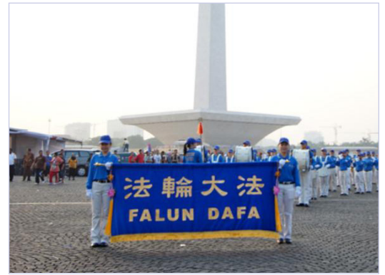
Các học viên Pháp Luân Công tham gia Lễ Diễu hành Văn hóa Dân gian tại Jakarta.