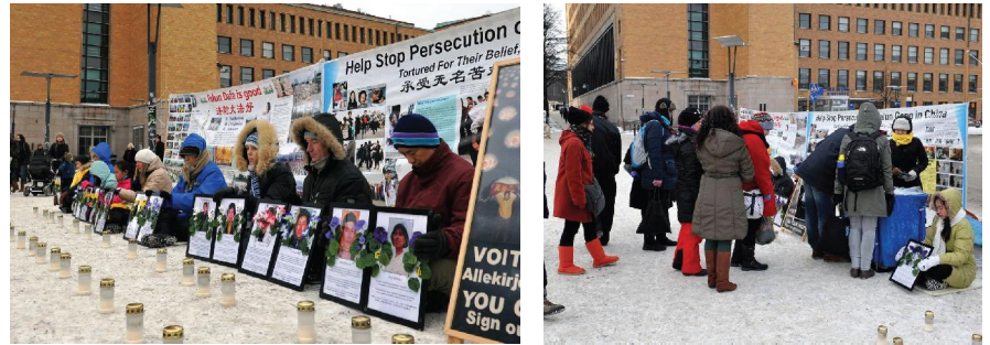
Các học viên Helsinki tổ chức một sự kiện kêu gọi vì hòa bình và chấm dứt cuộc bức hại

[MINH HUỆ] Ngày 27 tháng 01 năm 2013 là Ngày tưởng niệm Quốc tế về nạn diệt chủng. Nhân dịp hồi tưởng về thảm kịch trong quá khứ này, các học viên Pháp Luân Công ở Helsinki hy vọng sẽ nâng cao nhận thức về những tội ác đang diễn ra ở Trung Quốc ngày nay. Họ đã tập trung trên quảng trường cạnh nhà ga xe lửa và thắp nến để tưởng niệm những nạn nhân đã chết trong cuộc bức hại tàn bạo đã kéo dài 13 năm của Đảng cộng sản Trung Quốc (ĐCSTQ).