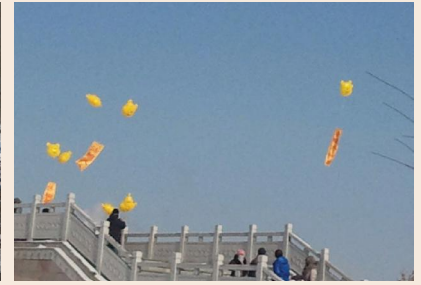
Quả bóng bay [mang dòng chữ] “Pháp Luân Đại Pháp Hảo”