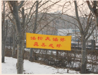
Xuất hiện biểu ngữ “Thoái Đảng bảo bình an” ở Hắc Long Giang

[MINH HUỆ] Trong dịp Tết Nguyên Đán, các biểu ngữ chân tướng đã xuất hiện nhiều nơi ở Trung Quốc như Hà Bắc, Hắc Long Giang, Sơn Đông... Trong ngày đầu năm mới tại một thành phố vùng Đông Bắc, nhiều người sau khi nhìn thấy quả bóng bay mang dòng chữ “Pháp Luân Đại Pháp Hảo” trong công viên thậm chí còn hô lớn: “Pháp Luân Đại Pháp Hảo!”