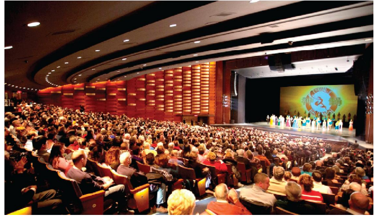
Thần Vận đã có 05 buổi biểu diễn bán hết sạch vé tại Trung tâm Nghệ thuật Biểu diễn Sony từ ngày 17 đến 20 tháng 01 năm 2013

[MINH HUỆ] Công ty Nghệ thuật Biểu diễn Thần Vận có trụ sở tại New York đã có 05 buổi biểu diễn ngoạn mục, bán hết sạch vé tại Trung tâm Nghệ thuật Biểu diễn Sony ở Toronto, Ontario vào các ngày từ 17 đến 20 tháng 01 năm 2013.