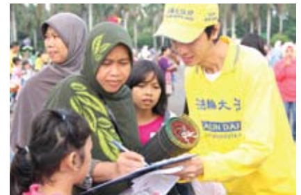
Người dân Jakarta ký tên để ủng hộ những nỗ lực của Pháp Luân Công trong việc chấm dứt cuộc bức hại

Sau khi hoạt động kết thúc, những người tham dự đã chụp ảnh tập thể để chúc mừng năm mới Sư phụ Lý Hồng Chí. ◇