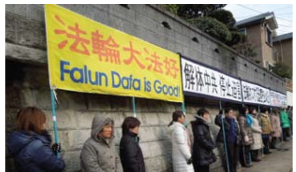
Các học viên Pháp Luân Đại Pháp phản đối tại Lãnh sự quán Trung Quốc ở Nagasaki, Nhật Bản

Ở vùng Kyushu, các học viên cũng tổ chức hai cuộc phản đối ôn hòa trước Lãnh sự quán Trung Quốc ở Nagasaki và Fukuoka từ 03 giờ chiều đến 05 giờ chiều và tiếp tục từ 07 giờ tối đến 01 giờ sáng. Các học viên đã dựng các tấm bảng trưng bày và biểu ngữ để phản đối những tội ác của ĐCSTQ. Trong hơn một thập kỷ qua, người dân ở gần Lãnh sự quán thường xuyên nhìn thấy các học viên Pháp Luân Đại Pháp phản đối ôn hòa tại Lãnh sự quán. Họ đã bày tỏ sự đồng tình của mình và khuyến khích các học viên tiếp tục kiên trì. ◇