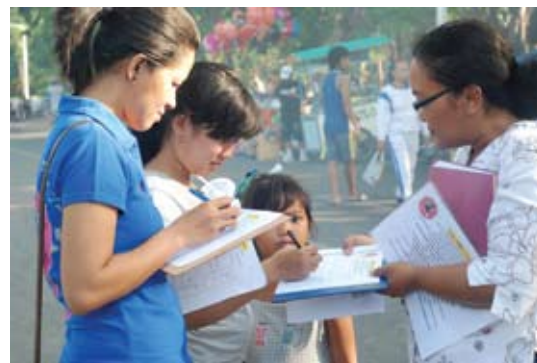
Người dân ký tên thỉnh nguyện kêu gọi chấm dứt cuộc bức hại Pháp Luân Công và tội ác mổ cướp nội tạng sống.

Bài viết của một học viên Pháp Luân Đại Pháp ở Indonesia