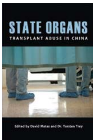
Cuốn sách: Tạng Nhà nước

Vào tháng 07 năm 2012, cuốn sách “Tạng Nhà nước” được phát hành. Đây là quyển sách thứ hai nhằm vạch trần thảm trạng của ĐCSTQ về mổ cướp nội tạng từ các học viên Pháp Luân Công trong khi họ vẫn đang còn sống. Cuốn sách bao gồm những bài viết, báo cáo từ 12 nhà chuyên môn, bao gồm năm bác sĩ và một nhà chuyên môn về lương tâm y học, từ bảy quốc gia trên bốn châu lục.