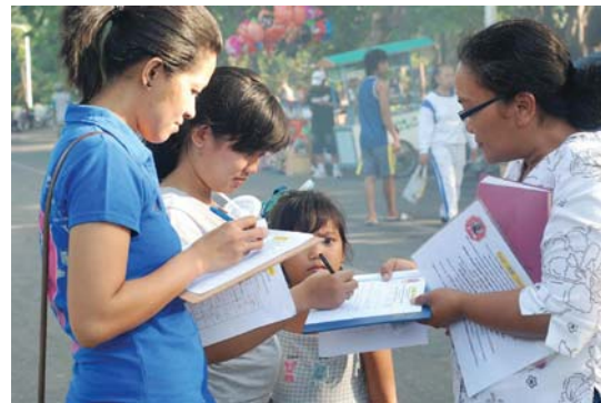
Người dân ký tên thỉnh nguyện kêu gọi chấm dứt cuộc bức hại Pháp Luân Công và tội ác mô cướp nội tạng sống.

Bài viết của một học viên Pháp Luân Đại Pháp ở Indonesia