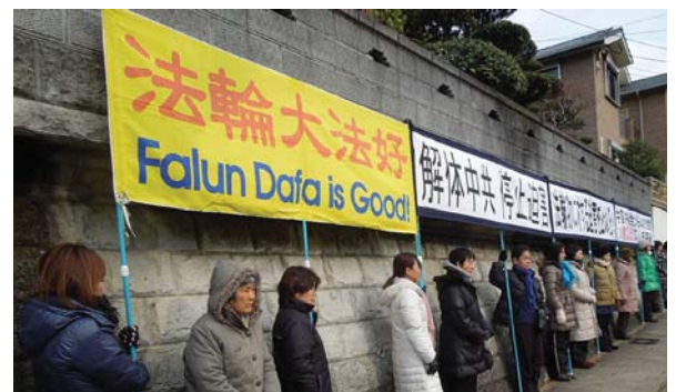
Các học viên Pháp Luân Đại Pháp phản đối tại Lãnh sự quán Trung Quốc ở Nagasaki, Nhật Bản

Ở vùng Kyushu, các học viên cũng tổ chức hai cuộc phản đối ôn hòa trước Lãnh sự quán Trung Quốc ở Nagasaki và Fukuoka từ 03 giờ chiều đến 05 giờ chiều và tiếp tục từ 07 giờ tối đến 01 giờ sáng. Các học viên đã dựng các tấm bảng trưng bày và biểu ngữ để phản đối những tội ác của ĐCSTQ. Trong hơn một thập kỷ qua, người dân ở gần Lãnh sự quán thường xuyên nhìn thấy các học viên Pháp Luân Đại Pháp phản đối ôn hòa tại Lãnh sự quán. Họ đã bày tỏ sự đồng tình của mình và khuyến khích các học viên tiếp tục kiên trì. ◇