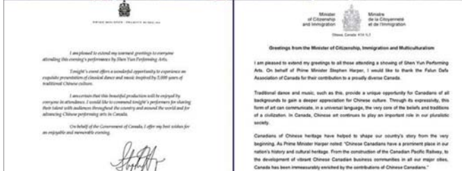
Thủ tướng Canada Stephen Harper, Bộ trưởng phụ trách Quốc tịch, Di trú và Đa văn hóa Canada, Jason Kenney, và nhà lãnh đạo Đảng Bảo thủ Tiến bộ của Ontario, Tim Hudak, đã gửi thư chúc mừng Thần Vận

[MINH HUỆ] Trong tháng 12/2012, Đoàn Nghệ thuật Thần Vận sẽ khởi động chuyến lưu diễn toàn cầu năm 2013 với những tiết mục hoàn toàn mới của mình. Năm nay sẽ có hơn 300 buổi diễn, bao gồm một số địa điểm mới. Chuyến lưu diễn mở màn cho năm 2013 diễn ra ở Buenos Aires từ các ngày 13 đến 21 tháng 12. Thần Vận sẽ có 30 buổi diễn ở Canada, đầu tiên là ở Mississauga vào ngày 20 tháng 12. Thủ tướng Canada, ông Stephen Harper, Bộ trưởng phụ trách Quốc tịch, Di trú và Đa văn hóa Canada, ông Jason Kenney, và nhà lãnh đạo đảng Bảo thủ Tiến bộ của Ontario, ông Tim Hudak, đã gửi thư chúc mừng tới Thần Vận.