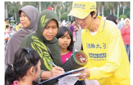
Người dân Jakarta ký tên để ủng hộ những nỗ lực của Pháp Luân Công trong việc chấm dứt cuộc bức hại

Sau khi hoạt động kết thúc, những người tham dự đã chụp ảnh tập thể để chúc mừng năm mới Sư phụ Lý Hồng Chí. ◇