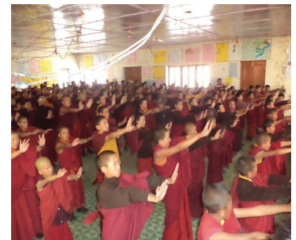
Học sinh tại một số trường học ở Ladakh học các bài công pháp của Pháp Luân Công