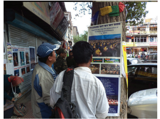
Các áp phích giảng chân tướng trên một khu phố đông đúc ở Leh

Nguồn cảm hứng để truyền những câu chuyện này một cách rộng rãi xuất phát từ một thanh niên trẻ tuổi, người sao chép đĩa