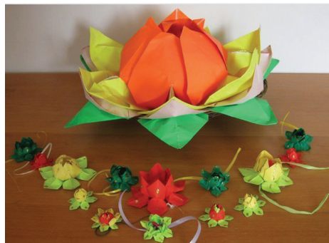
Các bông sen giấy

Pháp Luân Đại Pháp trên toàn thế giới đều là miễn phí, kể cả các điểm luyện công. Các cuốn sách của Pháp Luân Đại Pháp cũng luôn có sẵn và có thể tải miễn phí trên Internet. Tất cả mọi người đều có thể học các bài công pháp tuyệt vời và tu luyện tâm tính theo nguyên lý Chân – Thiện – Nhẫn. ◇