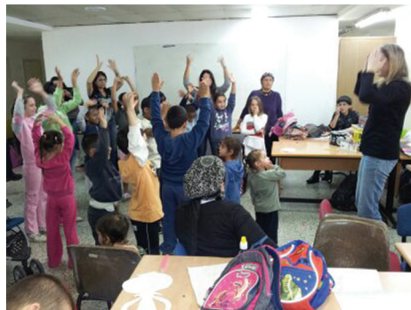
Hướng dẫn các bài công pháp Pháp Luân Công đầy uy lực

Ngày 21 tháng 11 năm 2012, trước khi lệnh ngừng bắn được ban bố, các học viên đã giúp các em nhỏ cùng bố mẹ các em luyện công tại nơi trú ẩn. Sau đó, họ đã cùng với người dân làm những bông hoa sen từ những mảnh giấy đầy màu sắc. Ban đầu, người lớn đã giúp những em nhỏ, nhưng sau đó chính bản thân họ cũng thấy rất thú vị. Một số người ở đó đã hào hứng tham gia luyện công tại các điểm luyện công hàng tuần của Pháp Luân Đại Pháp vốn cũng nằm trên một khuôn viên. Tất cả các hoạt động của