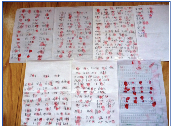
Chữ ký của những người dân làng trong đơn thỉnh nguyện yêu cầu thả cô Đàm

Tại trại lao động, công an đã bắt cô và các học viên làm việc quá tải với khối lượng công việc rất lớn, nếu không sẽ bị tra tấn. Các học viên nữ bị tách thành các nhóm nhỏ và ném vào các phòng giam nam. Họ cũng bị tra tấn bằng dùi cui điện, roi da, ngồi trên ghế hồ, không cho ngủ, không được sử dụng nhà vệ sinh, và ngồi xôm bên cạnh một ống sưởi nóng – một hình thức khiến cho phần chân bên dưới sẽ trở nên tê cứng và có cảm giác như hàng ngàn chiếc kim tiêm đang xuyên qua sau khi không được di chuyển một thời gian dài. Công an đã cố