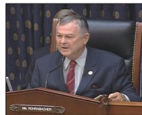
Ông Dana Rohrabacher, Chủ tịch Tiểu ban điều tra và giám sát của Ủy ban Ngoại giao Hạ viện

Quốc hội Hoa Kỳ đã tổ chức một phiên điều trần về “Mổ cướp nội tạng của các nạn bắt đồng chính kiến tôn giáo và chính trị của Đảng Cộng sản Trung Quốc” vào ngày 12 tháng 09, được chủ trì bởi Nghị sỹ Dana Rohrabacher, Chủ tịch Tiểu ban điều tra và giám sát. Ông Rohrabacher nói, “mổ cướp nội tạng là ‘hành động ma quỷ’... Nạn [thu hoạch nội tạng sống] này là một tội ác chống lại nhân loại và chúng ta nên nỗ lực hết mình xác định những cá nhân cụ thể đã tham gia vào việc này và đưa họ vào danh sách những kẻ đáng bị đưa ra trước công lý”.