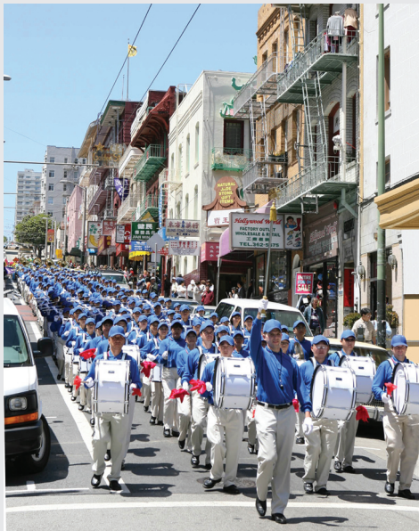
Abraham là người chỉ huy Thiên Quốc Nhạc Đoàn của miền Tây nước Mỹ. Anh ấy thường trình diễn trong những lần điều hành Pháp Luân Công ở San Francisco