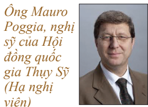
Ông Mauro Poggia, nghị sỹ của Hội đồng quốc gia Thụy Sĩ (Hạ nghị viện)

Vào tháng 09, ông Mauro Poggia, Nghị sỹ của Hội đồng quốc gia Thụy Sĩ, đã ban hành một bức thư ngỏ gửi đến Hội đồng Nhân quyền Liên Hợp Quốc kêu gọi điều tra tội ác mổ cướp nội tạng sống. Ông nói: Những tội ác ghê tởm này phải bị lên án, cần phải lập một ủy ban điều tra quốc tế ngay lập tức, và phải kiên Anh: quyết mạnh mẽ đưa những người chịu trách nhiệm ra xét xử.