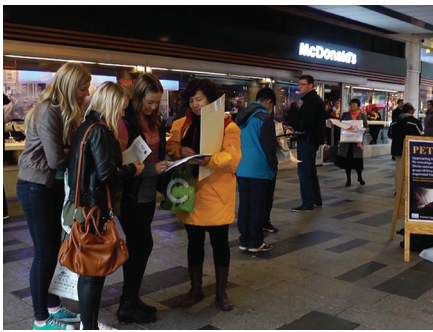
Ký tên thỉnh nguyện kêu gọi chấm dứt thu hoạch nội tạng từ các học viên Pháp Luân Công còn sống

Ông Andreas Norlen, thành viên của Nghị viện Thụy Điển, cho biết trong một cuộc phỏng vấn: “Tôi thật sự đã bị sốc. Những việc tàn bạo như vậy là hoàn toàn không thể chấp nhận được; thật khủng khiếp! Theo như tôi biết, một vài năm trước đây, đã có một cáo buộc trong một báo cáo của Liên Hợp Quốc về vấn đề này. Theo ý kiến của tôi, cần phải làm rõ những gì đang xảy ra. Bởi vì đó liên quan đến việc mở cướp nội tạng từ người còn sống, đó là sự vi phạm nhân quyền nghiêm trọng. Đặc biệt là trên một quy mô lớn như vậy với 40.000 người hoặc nhiều hơn nữa (bị cướp nội tạng), thật đáng sợ. Những người chịu trách nhiệm cần bị đưa ra trước công lý”.