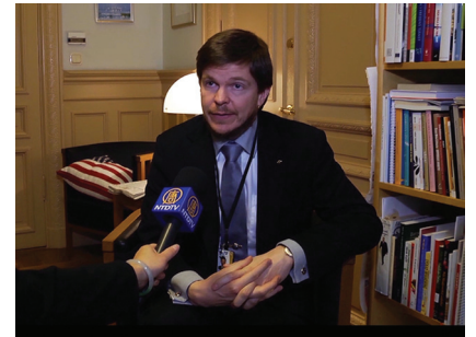
Ông Andreas Norlen, thành viên của Nghị viện Thụy Điển, được truyền thông phỏng vấn

Một người phụ nữ cùng với con trai của cô đã xin các học viên thêm tài liệu sau khi cô ký tên thỉnh nguyện. Cô nói: “Tôi sẽ cho thêm nhiều người biết về nó, tất cả chúng ta cần phải cùng nhau ngăn chặn nó”. ◇