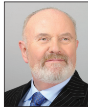
Thượng nghị sỹ Ai-len David Norris

Ông David Norris, một Thượng nghị sỹ cấp cao của Ai-len, đã nhiều lần lên tiếng lên án tội ác mổ cướp nội tạng sống từ các học viên Pháp Luân Công của Đảng Cộng sản Trung Quốc tại Thượng viện. Vào tháng 07 năm 2012, ông lại một lần nữa bày tỏ mối quan ngại sâu sắc của mình về nạn thu hoạch nội tạng sống ở Trung Quốc, và hy vọng rằng thủ đoạn tà ác sẽ không xảy ra lần nữa. ◊