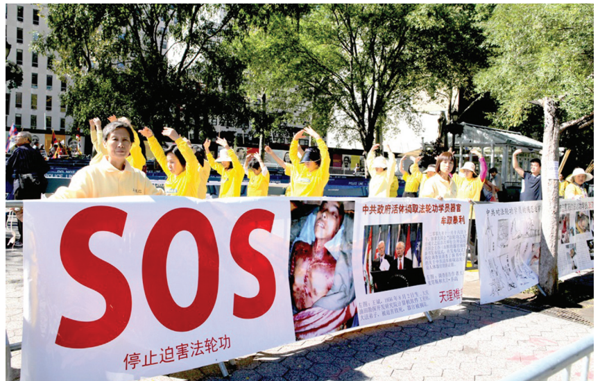
Các học viên Pháp Luân Công phơi bày tội ác của ĐCSTQ bên ngoài tòa nhà Liên Hiệp Quốc ở New York

Tội ác mổ cướp nội tạng sống và sau đó giết hại các học viên Pháp Luân Công để kiếm lợi của ĐCSTQ đang bị phơi bày và lên án bởi cộng đồng quốc tế và người dân Trung Quốc. Trong suốt thời gian diễn ra phiên họp của Đại Hội đồng Liên Hợp Quốc, các học viên địa phương ở New York đã phân phát hàng nghìn bản sao của các báo cáo chi tiết về tội ác mổ cướp nội tạng sống của ĐCSTQ cho những người tham dự phiên họp. Họ đã trưng các biểu ngữ lớn có dòng chữ “Chấm dứt mổ cướp nội tạng sống”, “Các trại lao động của ĐCSTQ giết hại các học viên Pháp Luân Công vì tiền và hòa thiêu thi thể của họ để phi tang”, và “Những tội ác như vậy phải bị trừng phạt” bằng cả tiếng Trung Quốc và tiếng Anh. Các biểu ngữ này đã gây sự chú ý bên ngoài trụ sở của Liên Hợp Quốc và những người tham dự phiên họp có thể nhìn thấy từ xa.