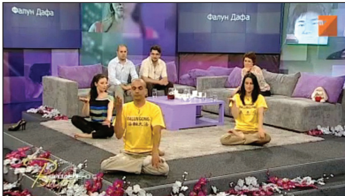
Kênh truyền hình quốc gia TV7 của Bulgaria phát sóng chương trình talkshow dài 50 phút về Pháp Luân Công

[MINH HUỆ] Ngày 20 tháng 09 năm 2012, kênh truyền hình quốc gia TV7 của Bulgaria đã giới thiệu môn tu luyện Pháp Luân Đại Pháp trên chương trình Talkshow buổi chiều “Chia sẻ với Vihra”. Các học viên Pháp Luân Công Bulgaria đã chia sẻ với người dẫn chương trình những câu chuyện về bản thân họ bắt đầu tập luyện như thế nào, những lợi ích thu được, và gia đình của họ đã chấp nhận Pháp Luân Đại Pháp ra sao. Các học viên đã biểu diễn năm bài công pháp. Người dẫn chương trình và khán giả trong phòng thu cũng tham gia màn biểu diễn các bài công pháp.