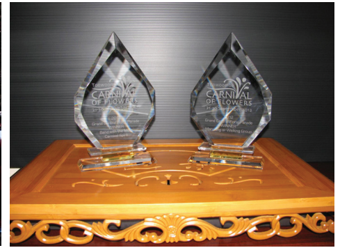
Tiết mục Pháp Luân Công đã giành hai giải thưởng tại Đại diễn hành hoa Toowoomba lần thứ 63: giải thưởng Đại lễ hội hoa Toowoomba và giải thưởng Đoàn có tinh thần lễ hội cao nhất

Doanh nhân Trung Quốc, sinh viên, và khách du lịch đã chụp ảnh và quay phim đoàn Pháp Luân Công. Nhiều người bày tỏ sự thích thú đối với Pháp Luân Công. Một khách du lịch đến từ Golden Coast nói với một học viên Pháp Luân Công: “Khi tôi thấy đoàn diễu hành của các bạn và thông điệp trên các biểu ngữ, tôi đã kinh ngạc. Tôi muốn tìm hiểu về Pháp Luân Công. Tôi phải học Pháp Luân Công.” ◇