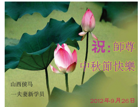
Các học viên mới từ Trung Quốc kính chúc Sư phụ Tết Trung thu vui vẻ!