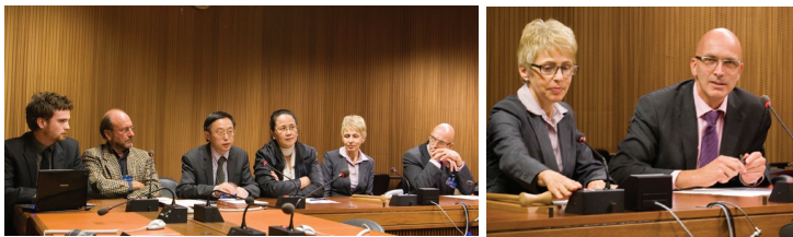
Thảo luận nhóm sau khi phim Giải phóng Trung Quốc: Kiên định niềm tin được chiếu tại cuộc họp Hội đồng của Đại Hội đồng Nhân quyền Liên Hợp Quốc tại Geneva, ngày 19 tháng 09, năm 2012.