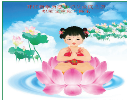
Các học viên mới, một cặp vợ chồng, từ Hầu Mã, thành phố Lâm Phân ở tỉnh Sơn Tây, kính chúc Sư phụ Tết Trung thu vui vẻ!