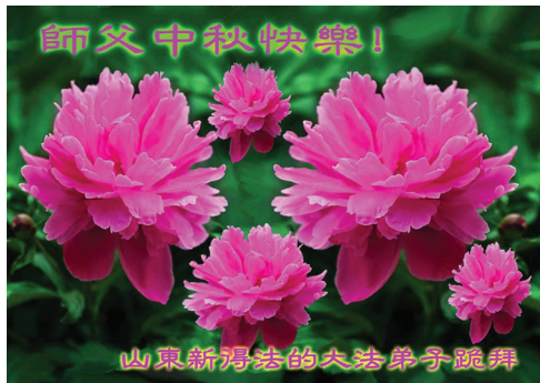
Các học viên mới từ Sơn Đông kính chúc Sư phụ Tết Trung thu vui vẻ!

Thông qua những nỗ lực giảng rõ sự thật về Pháp Luân Công của các học viên, ngày càng có nhiều người ở Trung Quốc nhận ra vẻ đẹp và sự tốt lành của Pháp Luân Đại Pháp. Từ đó, họ đã tiếp tục đến và bắt đầu tu luyện. Nhân dịp Tết Trung thu, các học viên mới này đã gửi lời chúc mừng đến Sư phụ và bày tỏ lòng biết ơn của họ đối với sự cứu độ từ bi của Ngài.