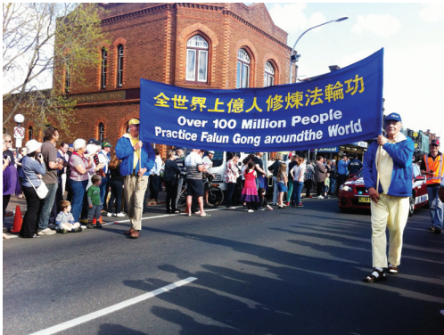
Buổi diễu hành

Các học viên Pháp Luân Công ở Sydney, Australia đã được mời đến biểu diễn trong buổi Diễu hành Đường phố Lễ hội hoa Tulip ở Bowral (Tulip Time Bowral) vào ngày 22 tháng 09 năm 2012.