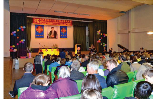
Pháp hội chia sẻ kinh nghiệm ở Nga năm 2012