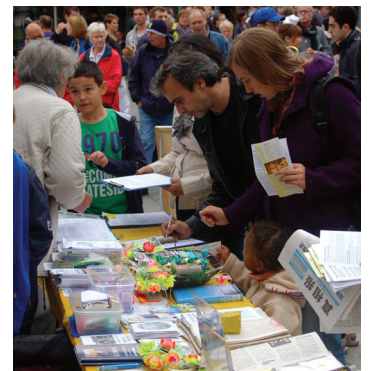
Người dân dừng lại ký tên thỉnh nguyện ủng hộ cho những nỗ lực chấm dứt bức hại của các học viên Pháp Luân Công

Đài truyền hình địa phương WDR và một tờ báo địa phương đã đưa tin sự kiện này. ◇