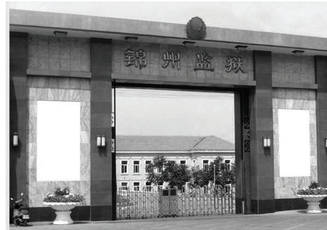
Nhà tù Cẩm Châu ở tỉnh Liêu Ninh