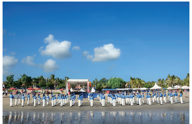
Thiên Quốc Nhạc Đoàn biểu diễn ở trước cổng chính

Các học viên Pháp Luân Công trình bày tại Hội đồng thành phố đã thu hút sự chú ý của các phương tiện truyền thông địa phương. Cả hai thời báo Yorkshire Evening Post và Leeds Citizen đã có những bài viết về buổi trình bày của các học viên Pháp Luân Công tại Hội đồng thành phố và Triển lãm nghệ thuật quốc tế Chân – Thiện – Nhẫn. ◇