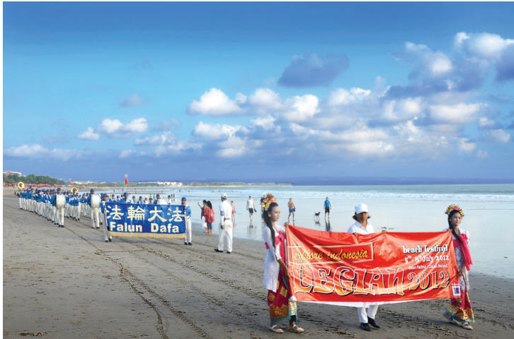
Đoàn tham gia vào lễ diễu hành của Lễ hội bãi biển Legian

Viết bởi một học viên Pháp Luân Đại Pháp ở Bali