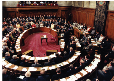
Đại hội đồng của Hội đồng thành phố Leeds (Anh tư liệu)

[MINH HUỆ] Vào ngày 11 tháng 07 năm 2012, tại Đại hội đồng của Chính quyền thành phố Leeds, các học viên Pháp Luân Công ở Anh đã kể lại chi tiết việc Đảng Cộng sản Trung Quốc (ĐCSTQ) bức hại Pháp Luân Công với Thị trường thành phố Leeds, gần 100 thành viên hội đồng, và một chục quan chức cao cấp của chính quyền thành phố. Họ đã yêu cầu Hội đồng Leeds tuyên bố công khai kêu gọi chấm dứt cuộc đàn áp Pháp Luân Công của ĐCSTQ. Đề nghị được nhất trí ủng hộ bằng việc giơ tay biểu quyết, thành công này dẫn đến giai đoạn tiếp theo của cuộc thảo luận.