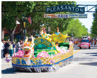
Thuyền của các học viên Pháp Luân Công