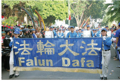
Đoàn Nhạc Thiên Quốc

Nhiều người dân địa phương rất thích đoàn nhạc vì giai điệu của họ, những bộ trang phục rực rỡ và các nguyên lý Chân – Thiện – Nhân mà các thành viên của đoàn nhạc tuân theo. ◇