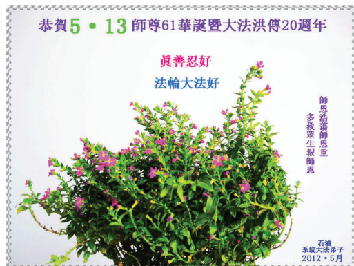
Các học viên Pháp Luân Đại Pháp ở ngành dầu khí Chúc mừng sinh nhật Sư Tôn và Chúc mừng kỷ niệm 20 năm Pháp Luân Đại Pháp hồng truyền!