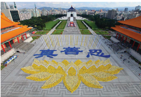
Hơn 5.000 học viên đã xếp hình một bông hoa sen khổng lồ và ba chữ Trung Quốc "Chân-Thiện-Nhẫn" vào ngày 27 tháng 11 năm 2010.