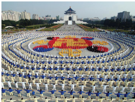
Bốn nghìn học viên xếp thành một Đồ hình Pháp Luân tại Đài Loan vào ngày 25 tháng 12 năm 2005.