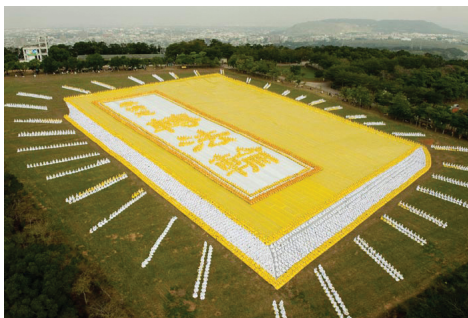
Sáu nghìn học viên trong khu vực châu Á-Thái Bình Dương xếp một mô hình lớn của cuốn sách Chuyên Pháp Luân để bày tỏ lòng tôn kính đối với Sư phụ Lý Hồng Chí, ngày 21 tháng 11 năm 2009.