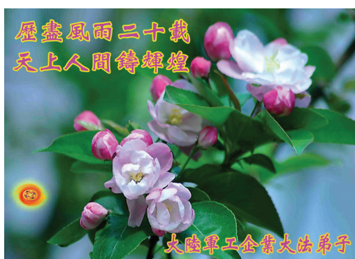
Các học viên Pháp Luân Đại Pháp ở các doanh nghiệp quân sự Trung Quốc Chúc mừng sinh nhật Sư Tôn và Chúc mừng Ngày Pháp Luân Đại Pháp thế giới!