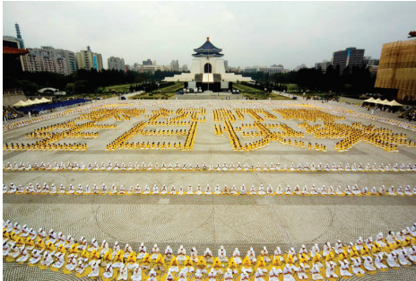
Hơn 5.000 học viên xếp thành các chữ Trung Quốc "Cung chúc Sư Tôn sinh nhật vui vẻ" tại quảng trường kỷ niệm đường Trung Chính, thành phố Đài Bắc, Đài Loan, ngày 13 tháng 05 năm 2007.

Dưới đây là một số hình ảnh các hoạt động xếp chữ Trung Quốc và tạo hình tại Đài Loan trong những năm qua.