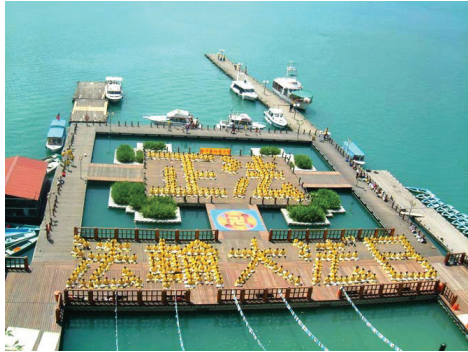
Tháng 07 năm 2002, kỷ niệm Ngày Pháp Luân Đại Pháp Thế Giới

Các học viên ở Đài Loan đã tổ chức các hoạt động quy mô lớn trong vòng 13 năm qua để nâng cao nhận thức của người dân về cuộc đàn áp Pháp Luân Công đồng thời khơi gợi thiện niệm và lương tri con người, và kêu gọi mọi người từ tất cả các tầng lớp xã hội giúp ngăn chặn cuộc đàn áp. ◇