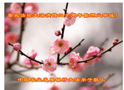
Các học viên Pháp Luân Đại Pháp ở Ngân hàng Phát triển Nông nghiệp Trung Quốc Chúc mừng sinh nhật Sư Tôn và Chúc mừng kỷ niệm 20 năm Pháp Luân Đại Pháp hồng truyền!