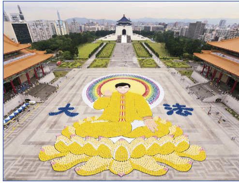
Tại Quảng trường Tự do ở Đài Bắc, 7.400 học viên Pháp Luân Công tạo thành hình ảnh của Sư Phụ Lý Hồng Chí, người sáng lập Pháp Luân Công - một cảnh tượng huy hoàng, vào ngày 29 tháng 04 năm 2012.

[MINH HUỆ] Vào ngày 29 tháng 04 năm 2012, nhân kỷ niệm 17 năm Pháp Luân Công được phổ truyền tại Đài Loan, 7.400 học viên Pháp Luân Công đã tập hợp tại Quảng trường Tự do ở Đài Bắc và xếp hình chân dung Sư Phụ Lý Hồng Chí, người sáng lập Pháp Luân Công. Các học viên chuẩn bị trong ba ngày cho sự kiện này, và những người tham gia chuẩn bị và xếp hình đều cảm nhận thấy bầu không khí thù thắng và trang nghiêm. Họ cảm thấy vinh dự và may mắn khi được đích thân tham dự sự kiện to lớn này.