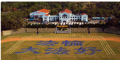
Khoảng 4000 học viên xếp thành các chữ Trung Quốc "Pháp Luân Đại Pháp là tốt" tại ngôi làng nhỏ mới mở Trung Hưng, huyện Nam Đầu, ngày 01 tháng 12 năm 2007.