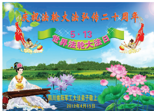
Các học viên trong ngành Công nghiệp quốc phòng ở Miên Dương, tỉnh Tứ Xuyên, mừng kỷ niệm lần thứ 20 ngày Pháp Luân Đại Pháp hồng truyền!