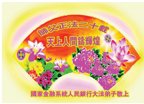
Các học viên Pháp Luân Đại Pháp ở hệ thống tài chính Chúc mừng sinh nhật Sư Tôn và Chúc mừng Ngày Pháp Luân Đại Pháp thế giới!

[MINH HUỆ] Hai mươi năm trước cũng vào tháng 05 này, Sư Phụ Lý Hồng Chí đã giới thiệu Pháp Luân Đại Pháp ra công chúng tại thành phố Trường Xuân, Trung Quốc. Kể từ đó Pháp Luân Đại Pháp đã được hồng truyền trên khắp thế giới. Khoảng hơn 100 triệu học viên đang tuân theo các tiêu chuẩn Chân-Thiện-Nhẫn và đã thu được rất nhiều lợi ích cả về cả tâm tính lẫn thân thể. Mười ba năm qua, mỗi khi đến ngày 13 tháng 05, các học viên Pháp Luân Đại Pháp trên khắp thế giới lại gửi các tấm thiệp chúc mừng đến trang web Minghui.org (trang Minh Huệ tiếng Trung) để kỷ niệm Ngày Pháp Luân Đại Pháp thế giới và chúc Sư Phụ tôn kính sinh nhật vui vẻ. Dưới đây là một số thiệp mừng năm nay được chọn để công bố. ◇