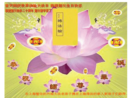
Các học viên là những cựu quân nhân của lực lượng không quân chúc mừng Ngày Pháp Luân Đại Pháp Thế Giới!