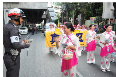
Các học viên Pháp Luân Công tham gia Lễ hội diễu hành Sangkran ở Bangkok

một món quà cảm ơn làm kỷ niệm. Ông Chatparitta, Chủ tịch Ban tổ chức nói rằng họ rất vui vì có Pháp Luân Công là một phần của chương trình. Ông chúc các học viên một cái Tết Thái vui vẻ. ◇