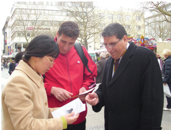
Vận động viên đến từ Palestine tham dự Giải vô địch bóng bàn đồng đội thế giới đang trò chuyện với một học viên Pháp Luân Công

[MINH HUỆ] Từ ngày 25 tháng 03 đến ngày 01 tháng 04 năm 2012, Giải vô địch bóng bàn đồng đội thế giới đã được tổ chức tại thành phố Dortmund, Đức. Các học viên Pháp Luân Đại Pháp đến từ bang Nordrhein-Westfalen nước Đức đã nắm bắt cơ hội để giảng chân tướng cho các vận động viên, cư dân địa phương và du khách.