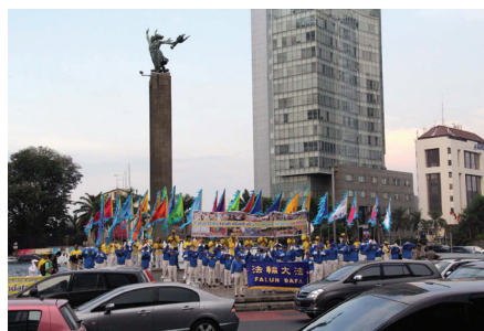
Các học viên Pháp Luân Đại Pháp tổ chức các hoạt động trước khách sạn Indonesia ở Jakarta

Sự kiện này là một trong những hoạt động đang được tổ chức ở các thành phố lớn trên khắp Indonesia để hưởng ứng “Tháng Pháp Luân Đại Pháp” sắp tới. Các học viên tham gia đã bày tỏ niềm hạnh phúc và sự biết ơn của họ. Một người nói: “Chúng tôi rất hạnh phúc được tu luyện Đại Pháp và tạ ơn Sư phụ Lý Hồng Chí vì đã giới thiệu Pháp Luân Đại Pháp ra công chúng 20 năm trước.”