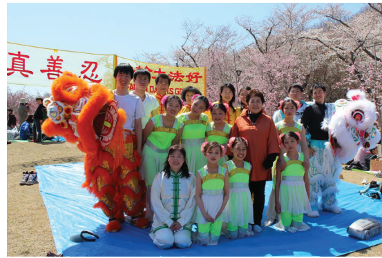
Sau tiết mục biểu diễn, vợ của chủ tịch Kito đã chụp ảnh với các học viên