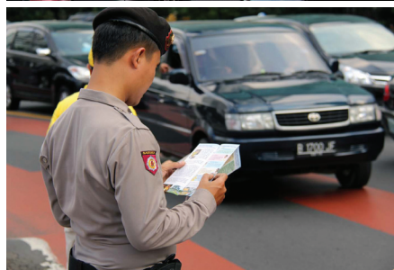
Nhân viên cảnh sát đang đọc tờ rơi giảng chân tướng

Mặc dù Pháp Luân Đại Pháp bị đàn áp và vu khống ở Trung Quốc từ năm 1999, ngày càng thêm nhiều người trên khắp thế giới đã bắt đầu tập luyện Pháp Luân Đại Pháp, trong đó có nhiều người Indonesia. ◇