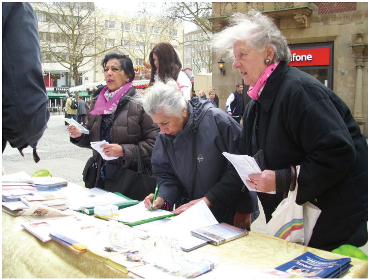
Người dân ký thỉnh nguyện thư phản đối cuộc bức hại và yêu cầu chấm dứt ngay lập tức việc thu hoạch nội tạng của các học viên Pháp Luân Công đang còn sống tại Trung Quốc