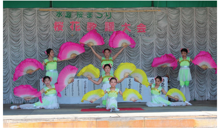
Các tiểu đệ nữ Pháp Luân Đại Pháp biểu diễn một điệu múa quạt truyền thống

Một phụ nữ gốc Trung Quốc đến từ Thẩm Dương, Trung Quốc, đã đưa các con và mẹ cô, đang từ Trung Quốc sang thăm, ra công viên. Họ đã nói chuyện với các học viên và đã biết sự thật về cuộc bức hại Pháp Luân Công ở Trung Quốc. Người phụ nữ sẵn sàng đồng ý thoát xuất đảng Cộng Sản Trung Quốc và các tổ chức liên đới mà cô đã từng gia nhập – đoàn thanh niên và đội thiếu niên. Mẹ của cô đã lấy các tài liệu thông tin. ◇