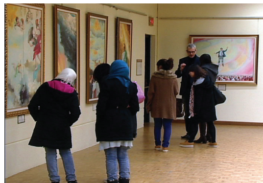
Hội trường triển lãm

[MINH HUỆ] Triển lãm Nghệ thuật Chân, Thiện, Nhẫn được tổ chức tại Trung tâm Nghiên cứu châu Á tại Đại học British Columbia, Vancouver, Canada vào ngày 04 tháng 04 năm 2012. Bốn mươi tác phẩm nghệ thuật của các học viên Pháp Luân Công đã được trưng bày.