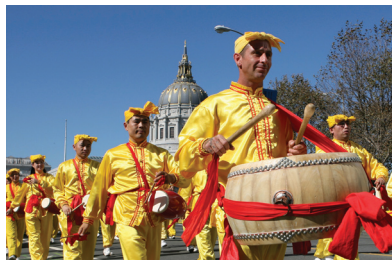
Đội đánh trống

Tôi sẽ liên tục niệm “Pháp Luân Đại Pháp hảo, Chân-Thiện-Nhẫn hảo!” ◇