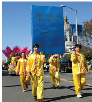
Mô hình sách Chuyển Pháp Luân