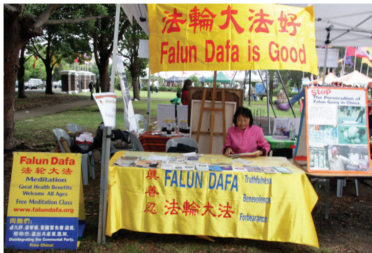
Gian hàng Pháp Luân Đại Pháp tại lễ hội Văn hóa châu Phi ở Auburn

Bài của phóng viên báo Minh Huệ Uyển Vận ở Sydney, Úc