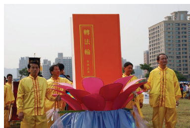
Học viên Pháp Luân Công trong các lễ diễu hành