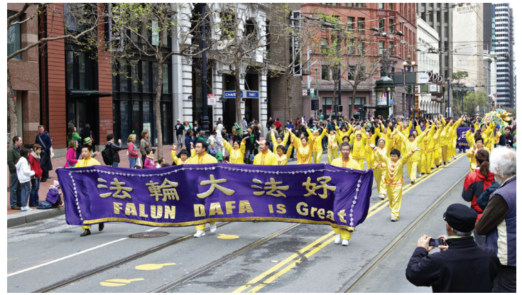
Nhóm biểu diễn các bài công pháp