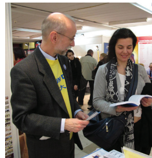
Các học viên giới thiệu Pháp Luân Công tại một triển lãm ở Ba Lan

Mặc dù họ đã tự tải về DVD hướng dẫn tập công và nhạc tập, nhiều khách tham quan đã vui mừng khi được hướng dẫn tập công trực tiếp trong thời gian triển lãm. Họ cũng để lại thông tin liên lạc