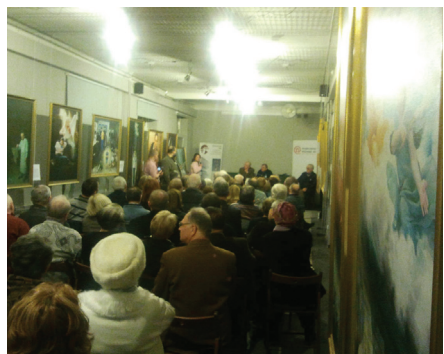
Mọi người xem các tác phẩm nghệ thuật vào ngày khai mạc Triển lãm