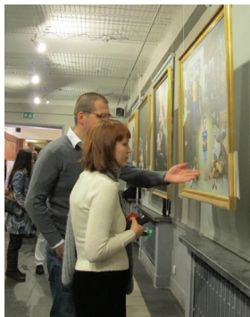
Khách tham quan bị cuốn hút bởi các tác phẩm nghệ thuật

Tại lễ khai mạc, Chủ tịch Hiệp hội Tự do ngôn luận, ông Wojciech Borowik, nói rằng thật khó để tin rằng một cuộc gọi điện thoại từ nước ngoài có thể tháo tung một bảo tàng nghệ thuật ở Ba Lan, một đất nước tự do. Ông nhận xét rằng nội dung các tác phẩm nghệ thuật không thể diễn tả bằng bất kỳ ngôn từ nào, và nói rằng họ đã cho thấy người Trung Quốc không có nhân quyền dưới chế độ của Đảng Cộng sản Trung Quốc.