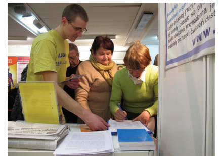
Khách tham quan hội chợ ký tên thỉnh nguyện phơi bày cuộc bức hại Pháp Luân Công

của mình để được thông báo về các điểm tập công địa phương. Nhiều người đã mua bản Chuyển Pháp Luân, và các học viên đã nhân cơ hội này tặng cho các khách tham quan những bông sen giấy tuyệt đẹp, gắn với một chiếc thẻ đánh dấu sách với thông điệp “Pháp Luân Đại Pháp hảo” và một giới thiệu ngắn về cuốn sách chính của Pháp Luân Đại Pháp, cuốn Chuyển Pháp Luân tiếng Ba Lan.