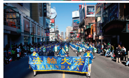
Đoàn nhạc đã được khán giả đón nhận nồng nhiệt. “Đoàn nhạc Pháp Luân Đại Pháp bao giờ cũng hay nhất!” một vài người hô lên.