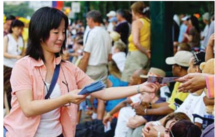
Một học viên Pháp Luân Đại Pháp gửi thông điệp Chân-Thiện-Nhẫn tới mọi người