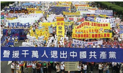
◀ Đoàn diễu hành hơn 10.000 người diễn ra tại Đài Loan phản đối cuộc bức hại Pháp Luân Công của ĐCSTQ