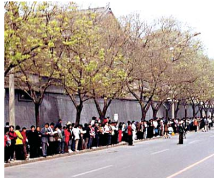
Hình ảnh các học viên đứng ôn hòa trật tự thỉnh nguyện, không kèm theo biểu ngữ (ngày 25 tháng 04 năm 1999)

Sự kiện mà ĐCSTQ lấy cớ để vu khống Pháp Luân Công biểu tình chính trị là việc ngày 25 tháng 04 năm 1999 hơn 10 ngàn học viên Pháp Luân Công tập hợp trong trật tự ôn hòa theo sự hướng dẫn của các cảnh sát trước Văn Phòng Kháng cáo Trung ương Trung Quốc tại Bắc Kinh, theo đúng tinh thần hiến pháp, yêu cầu trả tự do cho 45 học viên đã bị bắt bất hợp pháp trước đó.