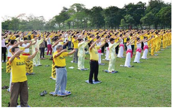
Các học viên Pháp Luân Đại Pháp Việt Nam

P háp Luân Đại Pháp được luyện tập tại Việt Nam từ đầu những năm 2000. Đến nay, số học viên Pháp Luân Đại Pháp đã phát triển nhanh ở nhiều thành phố: Hà Nội, Sài Gòn, Hải Dương, Quảng Ninh, Hải Phòng, Đà Nẵng... Tại các công viên như Thành Công,