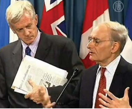
Ông David Kilgour và luật sư David Matas

Luật sư nhân quyền quốc tế, ông David Matas và cựu Nghị sĩ Canada Ngài David Kilgour, đã điều tra về việc chính quyền Trung Quốc mổ lấy và bán nội tạng của các học viên Pháp Luân Công đang còn sống. Kết quả điều tra đã được xuất bản thành sách “Sự thu hoạch đẫm máu: Giết hại Pháp Luân Công để lấy nội tạng” và hai ông đều được đề cử giải Nobel Hòa bình cho việc điều tra này.