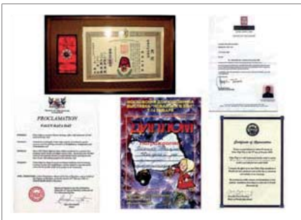
Lời khen ngợi từ các nước: Nhật Bản, Nga, Australia và New Zealand

Trong “Danh sách 100 thiên tài đương đại” năm 2007, Đại Sư Lý Hồng Chí được xếp hạng thứ 12, là người Hoa có ảnh hưởng lớn nhất đến thế giới đương thời. Năm 1996, Đại Sư Lý và gia đình đã tới định cư ở Hoa Kỳ theo chương trình “Nhân tài kiệt xuất.”