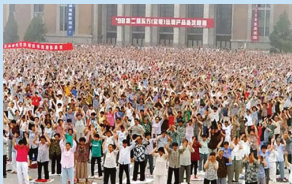
Tp. Thẩm Dương (trước năm 1999)

Là môn tu luyện ôn hòa, phi chính trị, mang lại nhiều lợi ích cả thân lẫn tâm nên Pháp Luân Công đã nhận được sự ủng hộ của đông đảo quần chúng nhân dân và giới quan chức trong Đảng Cộng sản Trung Quốc (ĐCSTQ). Chỉ sau vài năm ngắn ngủi kể từ ngày được chính thức công bố, Pháp Luân Công đã vô cùng phổ biến ở Trung Quốc. Vào cuối những năm 1990, theo thống kê của Chính phủ Trung Quốc có khoảng 70 -100 triệu người theo học pháp môn này.