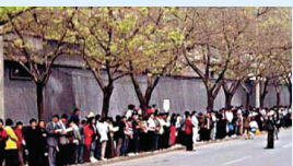
Hình ảnh các học viên đứng ôn hòa trật tự thỉnh nguyện, không mang theo biểu ngữ (ngày 25 tháng 4 năm 1999).

Một báo cáo năm 2007 của Liên Hợp Quốc có đoạn: “Những bộ phận thiết yếu của cơ thể gồm cả tim, thận, gan và giác mạc đã bị mổ cướp một cách có hệ thống từ các nạn nhân là học viên Pháp Luân Công tại Bệnh viện Tô Gia Đồn tỉnh Liêu Ninh từ năm 2001. Các học viên bị tiêm thuốc khiến truy tìm và họ bị giết ngay sau khi hoạt động mổ cướp nội tạng hoàn tất.”