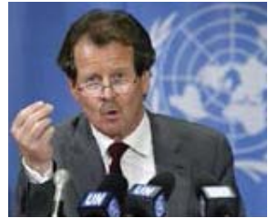
Ông Manfred Nowak

Một báo cáo năm 2007 do Liên Hợp Quốc xuất bản được thực hiện bởi ông Manfred Nowak- báo cáo viên đặc biệt của Liên Hợp Quốc về vấn đề Tra tấn cho thấy ĐCS TQ đã mổ cướp và bán nội tạng của những học viên Pháp Luân Công ngay cả khi họ vẫn đang còn sống.