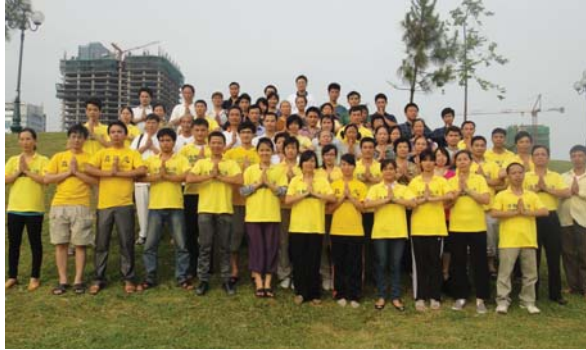
Các học viên Pháp Luân Đại Pháp Việt Nam

P háp Luân Đại Pháp được luyện tập tại Việt Nam từ đầu những năm 2000. Đến nay, số học viên Pháp Luân Đại Pháp đã phát triển nhanh ở nhiều thành phố: Hà Nội, Sài Gòn, Hải Dương, Quảng Ninh, Hải Phòng, Đà Nẵng... Tại các công viên như Thành Công, Thống Nhất, Tuổi Trẻ, Nghĩa Tân (Hà Nội), Bạch Đằng (Hải Dương), Tao Đàn, Phú Lâm (Sài Gòn)... đều có điểm luyện công chung.