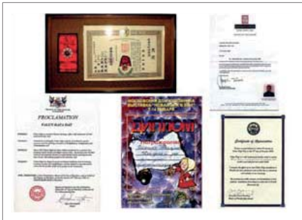
Lời khen ngợi từ các nước: Nhật Bản, Nga, Australia và New Zealand

Trong “Danh sách 100 thiên tài đương đại” năm 2007, Đại Sư Lý Hồng Chí được xếp hạng thứ 12, là người Hoa có ảnh hưởng lớn nhất đến thế giới đương thời. Năm 1996, Đại Sư Lý và gia đình đã tới định cư ở Hoa Kỳ theo chương trình “Nhân tài kiệt xuất.”