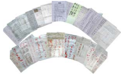
Hàng nghìn chữ ký và dấu vân tay của người dân TQ phản đối ĐCSTQ bắt giữ trái phép các học viên Pháp Luân Công