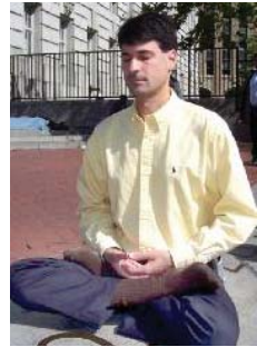
Tư thế ngồi song bàn của Pháp Luân Công

Tư thế ngồi thiền không đúng với kiểu ngồi song bàn của Pháp Luân Công