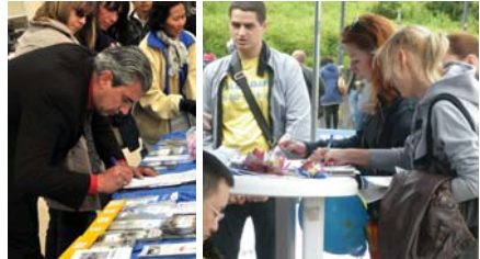
Người dân ký tên thỉnh nguyện phản đối cuộc bức hại