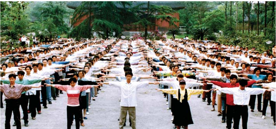
Người dân Tứ Xuyên, Trung Quốc đang luyện bài công pháp thứ nhất của Pháp Luân Đại Pháp (trước năm 1999)