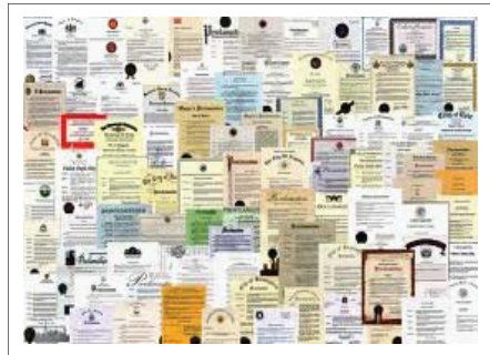
Các giải thưởng, bằng khen từ khắp nơi trên thế giới