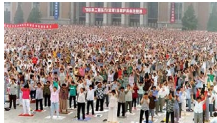
Tp. Thảm Dương (trước năm 1999)