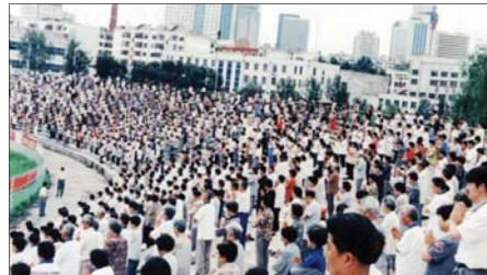
Tp. Hắc Long Giang (trước năm 1999)