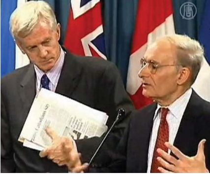
Ông David Kilgour và luật sư David Matas

Luật sư nhân quyền quốc tế, ông David Matas và cựu Nghị sĩ Canada Ngài David Kilgour, đã điều tra về việc chính quyền Trung Quốc mổ lấy và bán nội tạng của các học viên Pháp Luân Công đang còn sống. Kết quả điều tra đã được xuất bản thành sách “Sự thu hoạch đẫm máu: Giết hại Pháp Luân Công để lấy nội tạng” và hai ông đều được đề cử giải Nobel Hòa bình cho việc điều tra này.