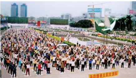
Quảng Châu đầu những năm 1990