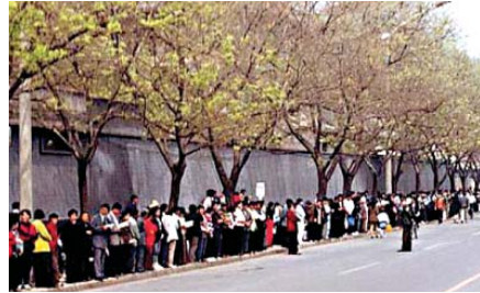
Hình ảnh các học viên đứng ôn hòa trật tự thỉnh nguyện, không kèm theo biểu ngữ (ngày 25 tháng 04 năm 1999)