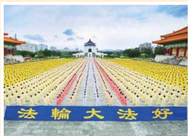
Ngày 26 tháng 11 năm 2011, hơn 6.000 học viên Pháp Luân Công tổ chức luyện công tập thể quy mô lớn tại quảng trường Tự Do, Đài Bắc, Đài Loan.