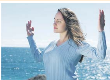
Cô gái người Mỹ đang luyện bài Pháp Luân Trang pháp, cô đắm chìm trong sự tĩnh lặng và bình yên. Trời và biển như nối liền, cùng hòa làm một với tâm hồn.