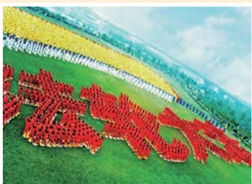
Ngày 27 tháng 3 năm 1999, tại công viên Hán Thủy, Hán Dương, thành phố Vũ Hán, gần 10.000 học viên Pháp Luân Công xếp hình bốn chữ lớn "Pháp Luân Đại Pháp".