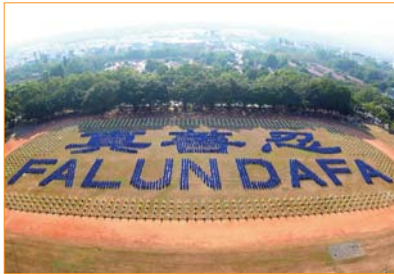
Hơn 3.000 học viên Pháp Luân Công cùng xếp chữ “Chân-Thiện-Nhẫn” và “Pháp Luân Đại Pháp” tại sân vận động thôn Trung Hưng, huyện Nam Đảo, Đài Loan.