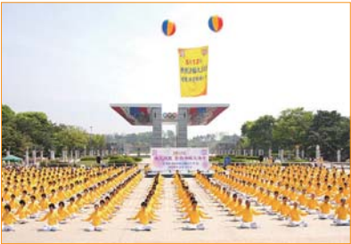
Tại rất nhiều công viên và sân trường ở Hàn Quốc, chúng ta đều có thể bắt gặp hình ảnh thanh bình của các học viên Pháp Luân Công luyện công tập thể.