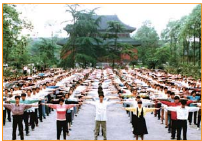
Đầu năm 1999, chỉ riêng tại thành phố Thành Đô, tỉnh Tứ Xuyên đã có mấy trăm nghìn người tu luyện Pháp Luân Công. Hàng ngày vào buổi sáng sớm, các học viên đến các điểm luyện công ở gần nhà để luyện các bài công pháp.