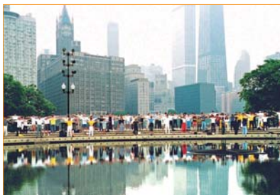
Sáng sớm ngày 27 tháng 6 năm 1999, các học viên tham gia Pháp hội giao lưu Pháp Luân Đại Pháp tại Chicago, Mỹ cùng nhau luyện công tập thể.