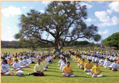
Ở châu Âu, các điểm luyện công của Pháp Luân Công phổ biến ở tất cả các thành phố lớn. Đây là hình ảnh luyện công tập thể tại công viên Brisbane.