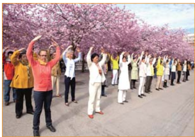
Vào đầu tháng 5, các học viên Pháp Luân Công tại Thụy Điển luyện công tập thể dưới tán cây hoa anh đào nở rộ trong công viên Hoàng gia, chào mừng ngày “Pháp Luân Đại Pháp Thế giới”.