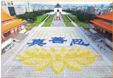
Hơn 5.000 học viên Pháp Luân Công xếp hình hoa sen và dòng chữ “Chân-Thiện-Nhân” trên quảng trường Tự do, Đài Bắc, triển hiện sự tốt đẹp của Pháp Luân Đại Pháp.