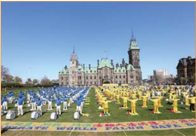
Tại Canada, từ tổng thống đến người dân đều yêu mến và ca ngợi Pháp Luân Công. Đây là hình ảnh các học viên Pháp Luân Công luyện công tập thể trước Tòa nhà Quốc hội Canada.