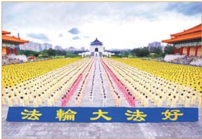
Hơn 7.000 học viên Pháp Luân Công luyện công tập thể trên quảng trường Tự do, Đài Bắc, ở Đài Loan hiện có hơn 10.000 người tu luyện Pháp Luân Công.