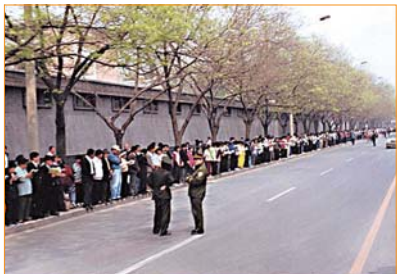
Hình ảnh 1 tại nơi diễn ra cuộc thỉnh nguyện ngày 25-4: không có khẩu hiệu, biểu ngữ, không có sự kích động của người biểu tình, mọi người trật tự đứng hai bên đường, cảnh sát nhàn nhã đứng tán gẫu.