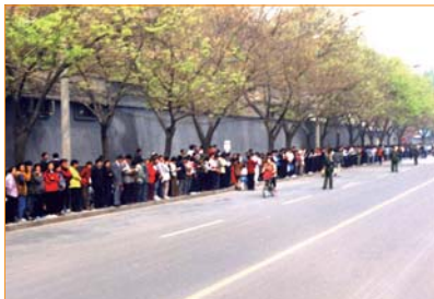
Hình ảnh 2 tại nơi diễn ra cuộc thỉnh nguyện ngày 25-4: từ đầu đến cuối, những người đến thỉnh nguyện tự giác đứng nhường đường cho khách bộ hành và xe cộ đi lại, họ đứng lặng lẽ trông ngóng và chờ đợi.