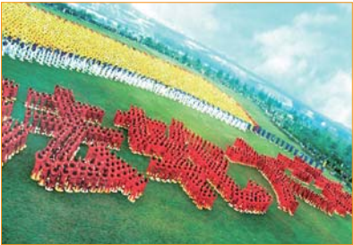
Năm 1999, tại công viên Hán Thủy, thành phố Vũ Hán, Trung Quốc, gần 10.000 học viên Pháp Luân Công xếp chữ “Pháp Luân Đại Pháp”