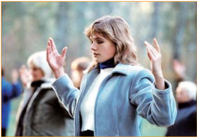
Các học viên Pháp Luân Công tại Nga đang luyện công bài công pháp số hai của Pháp Luân Công, một cảnh tượng thanh bình trong tiếng nhạc luyện công êm ái, du dương.

Trong số những người tu luyện Pháp Luân Công trên toàn thế giới, có nhiều người là giáo sư, nhà khoa học, họ đã bị cảm hóa sâu sắc bởi nguyên lý “Chân-Thiện-Nhẫn”, thông qua tu luyện họ đã đạt được thân thể khỏe mạnh và tinh thần hòa ái, họ cũng lĩnh hội được Pháp Luân Công không chỉ giảng về đạo lý làm người và phương pháp tu luyện, mà còn tiết lộ rất nhiều vấn đề mà khoa học ngày nay không cách nào lý giải nổi, đó là khoa học thực sự.