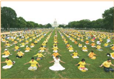
Hàng nghìn học viên Pháp Luân Công đến từ khắp nơi trên thế giới tụ tập tại thủ đô Washington, DC, Mỹ, cùng luyện công tập thể trước tòa nhà quốc hội Mỹ.

Pháp Luân Đại Pháp, còn gọi là Pháp Luân Công, là Đại Pháp tu luyện thượng thừa của Phật gia, lấy đặc tính vũ trụ “Chân-Thiện-Nhân” làm nguyên tắc chủ đạo, bao gồm năm bài công pháp nhẹ nhàng, thanh thoát. Sau khi được truyền ra công chúng, Pháp Luân Đại Pháp đã nhận được sự hoan nghênh của đông đảo người dân nhờ vào hiệu quả chữa bệnh kỳ diệu, chỉ trong vài năm ngắn ngủi, pháp môn đã lan truyền ra khắp đất nước Trung Quốc.